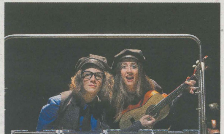
Una escena de la obra 'Inondik inora'. :: BENETAN BE