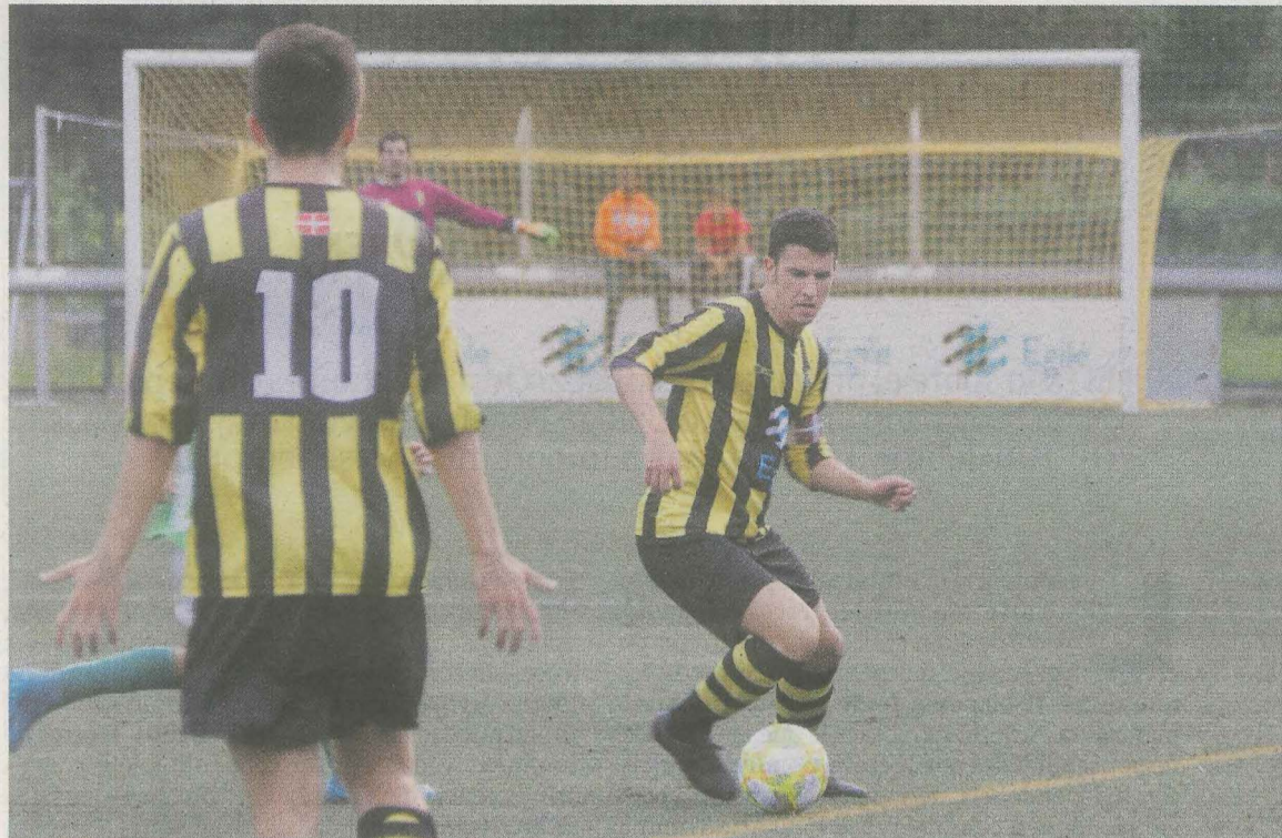
El regional masculino quiere mantenerse invicto en casa.