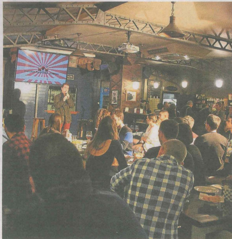
Intervención de uno de los jóvenes emprendedores.

Mañana se llevará a cabo la tradicional exposición micológica. Durante toda la mañana se contará con la ambientación musical de las trikitilaris de Alboka y se entregarán obsequios a los colaboradores de la organización. También se podrá disfrutar de la muestra de trabajos manuales infantiles elaborados en colegios ermuarras.