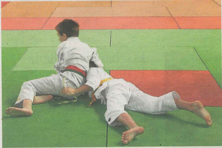
La iniciativa pretende formar y fomentar el deporte del yudo.