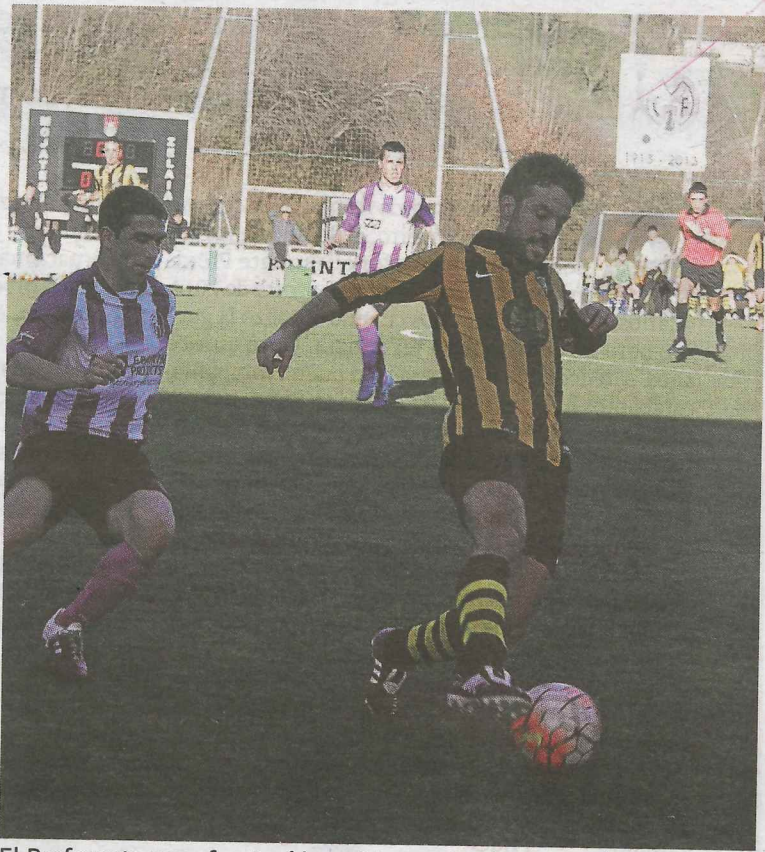
El Preferente se enfrentará hoy al Lagun Onak.

Las chicas del cadete comienzan una nueva liguilla en la que pelearán