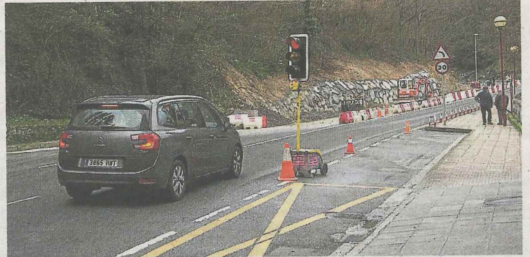
La seguridad peatonal aumentará notoriamente en la zona.

Con el propósito principal de que el tránsito de peatones sea más