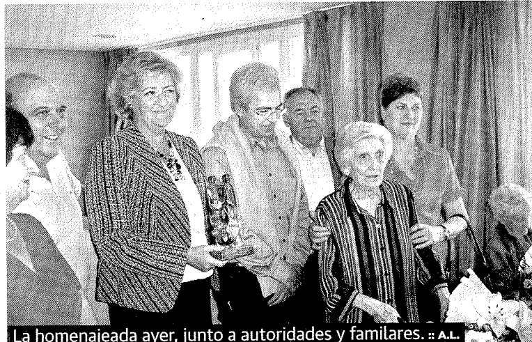
La homenajeadada ayer, junto a autoridades y familiares.