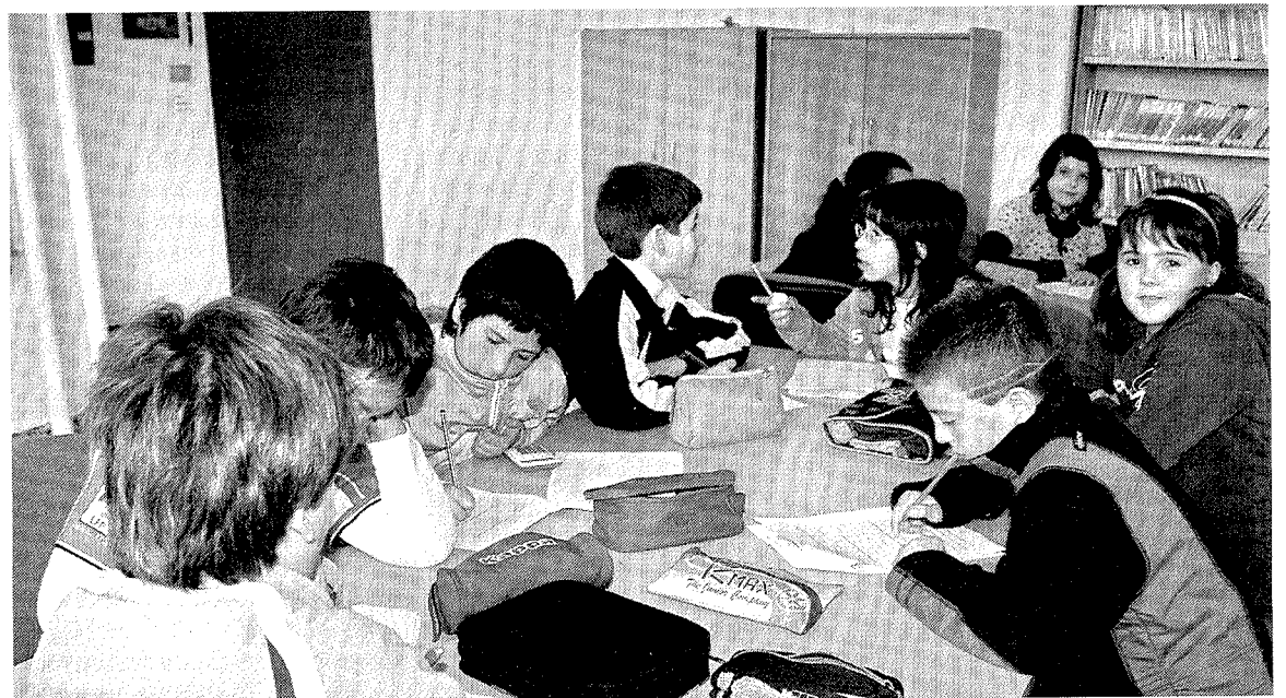
Escolares ermuarra asistentes a un taller de comprensión de facturas de luz y agua.

Cada día, en horario de mañana, la OMIC atiende las consultas y reclamaciones de los consumidores ermuarra, en la oficina que se encuentra en la planta baja de la plaza del mercado.