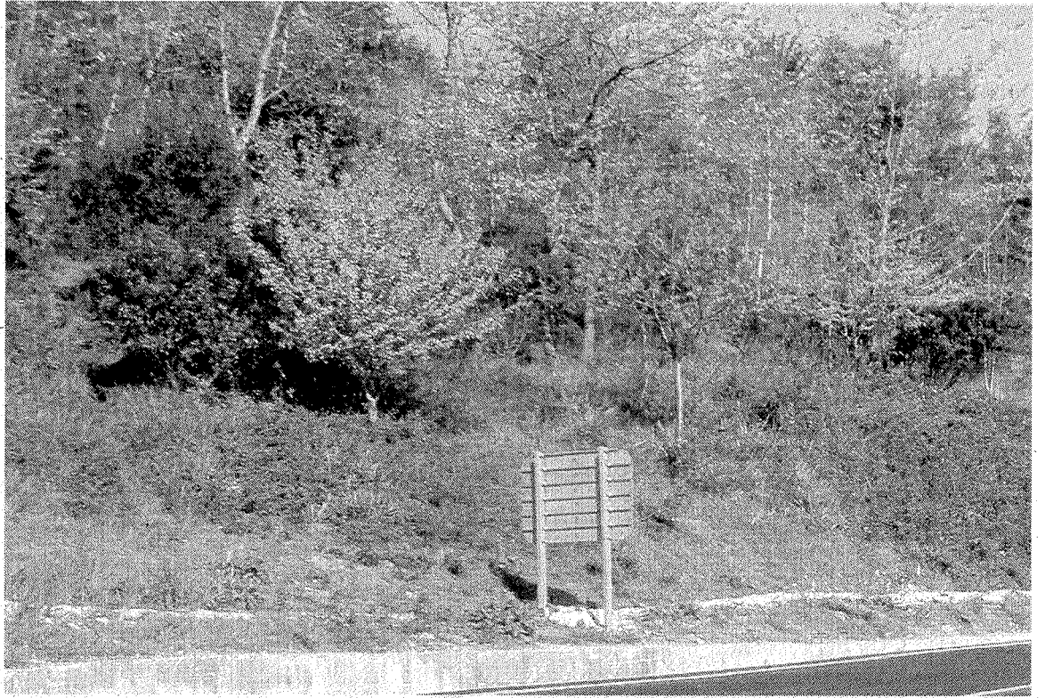
La apertura de la carretera ha sido recibida con la lógica satisfacción. •• GORRITIBERIA