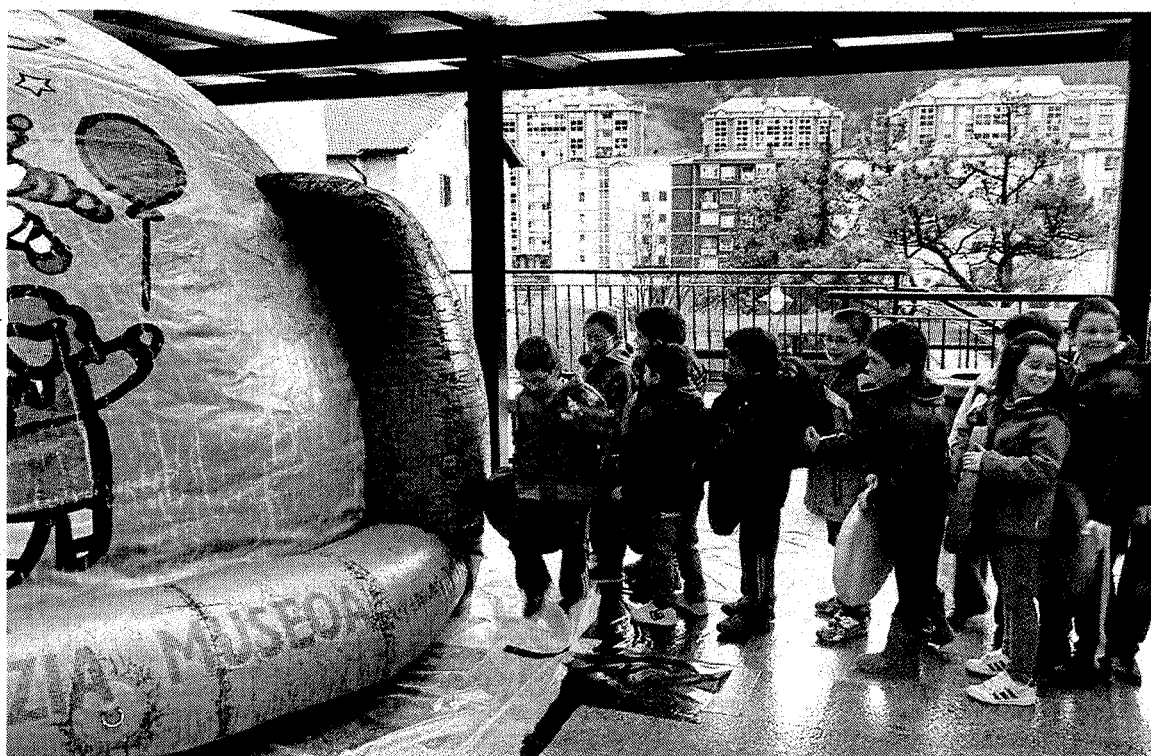
El planetario hinchable que se instaló en la anterior edición. A. L.

El martes, 6 de mayo, se centrará en la diversificación económica y las soluciones de apoyo a las personas mayores, crónicas y dependientes. 'Gerokon' abrirá la conferencia para hablar de 'Innovación social y diversificación económica'. La ponencia 'Smart Home, aplicaciones de la fibra óptica al sector sociosanitario' correrá a cargo de ECI Telecom Ltd. Además, representantes de Osaki-