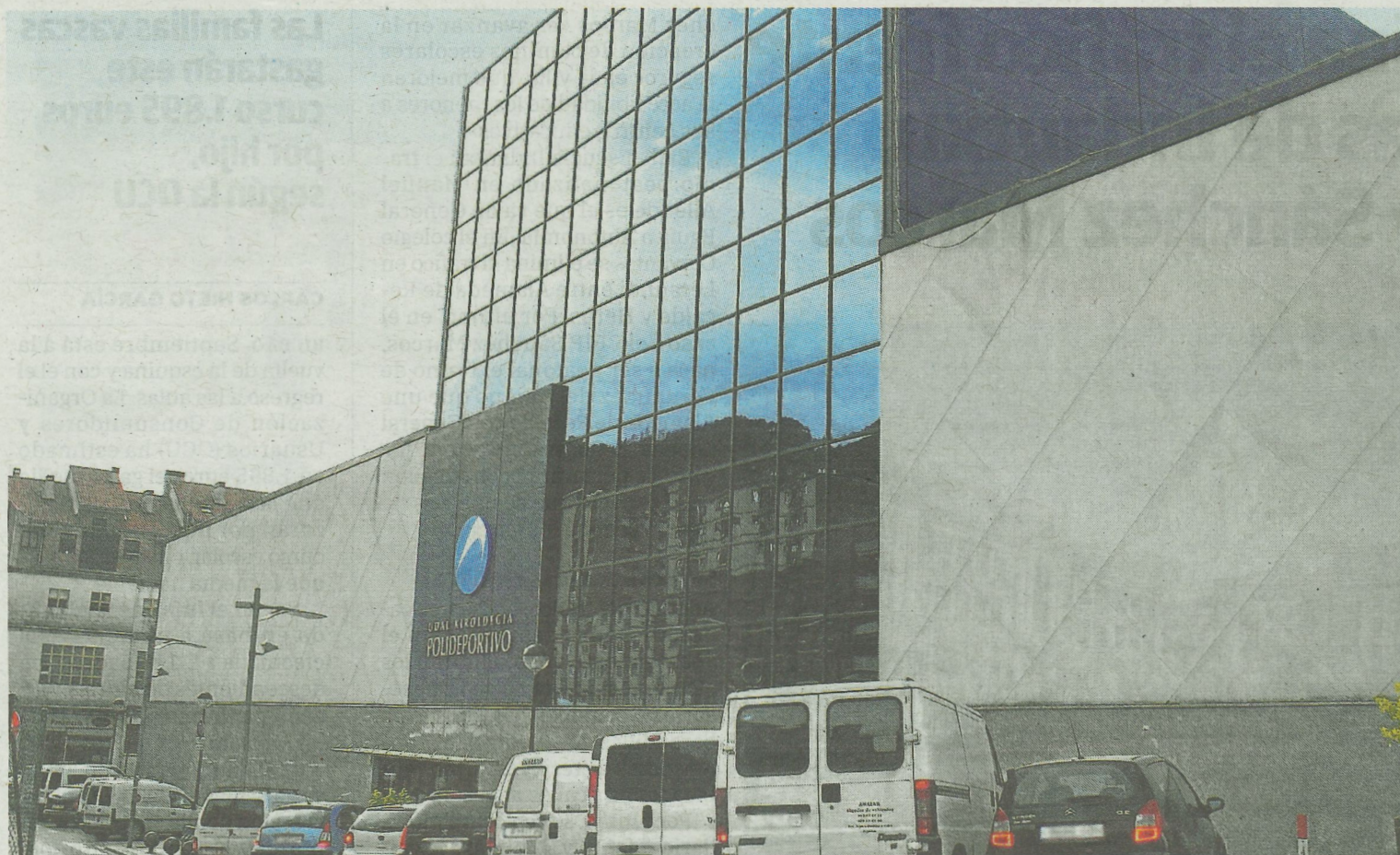
Gran parte de la actividad deportiva que se practica en interiores en la localidad se desarrolla en el polideportivo municipal. A.LASUEN