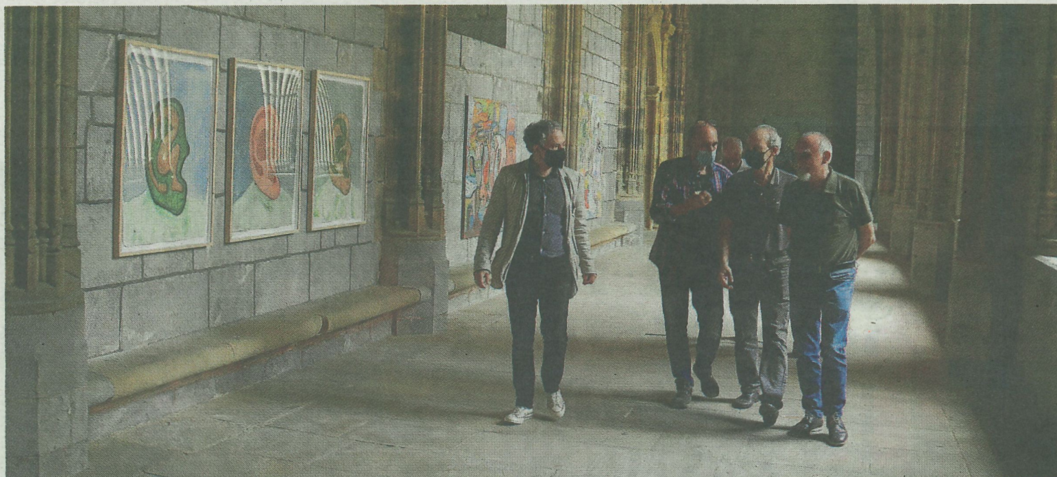
El claustro de la iglesia de Santa María acoge cada verano una exposición pictórica. SALEGI