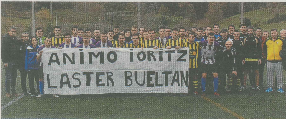
Los equipos se unieron tras una pancarta en apoyo al portero del Amaiak lesionado.