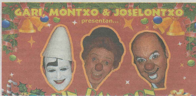
El espectáculo 'Din, Dan, Don' en el antzokia.

La función comenzará este jueves 27 de diciembre a las 17.00 horas en el Ermua Antzokia. Las entradas están a la venta por 4 euros en Lobiano Kultur Gunea (consulta el horario de las instalaciones