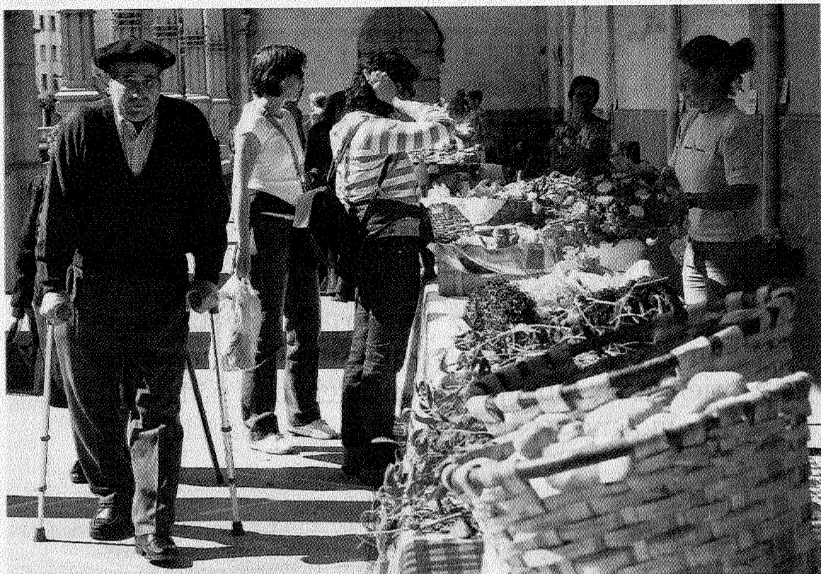
Inkestagileak egun eta ordu zehatz batzuetan irten ziren kaleetara.