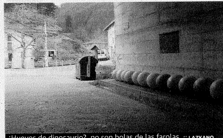
¿Huevos de dinosaurio?, no son bolas de las farolas. LAZKANO

LUMINARIAS. Una imagen que sorprende. Todas las bolas de las antiguas farolas del barrio de Plaza bien colocadas, una junto a otra, debajo del puente de la autopista. Cualquier imaginativo paseante podría crear una historia de 'mendaro-jurásico I'.