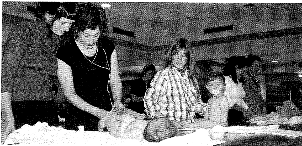
Curso de masaje para bebés que se ofreció en la anterior campaña de talleres.