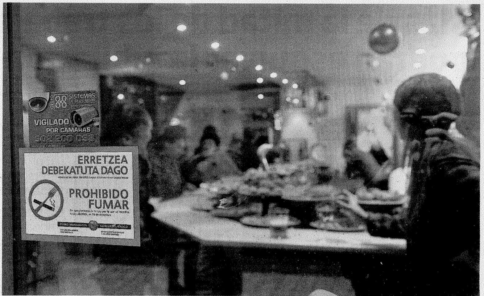
La prohibición de fumar en los establecimientos hosteleros entraba en vigor el pasado 2 de enero.