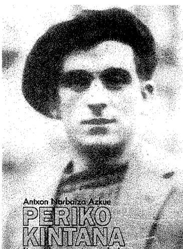
Portada del libro.

Pero si en prisión siempre buscó la manera de fugarse, cuando estaba en el frente se las apañó para desertar o para que lo enviaran de vuelta a casa. En definitiva, un hombre que nunca se quedaba de brazos cruzados ante las adversidades, siempre luchando por defender sus ideales.