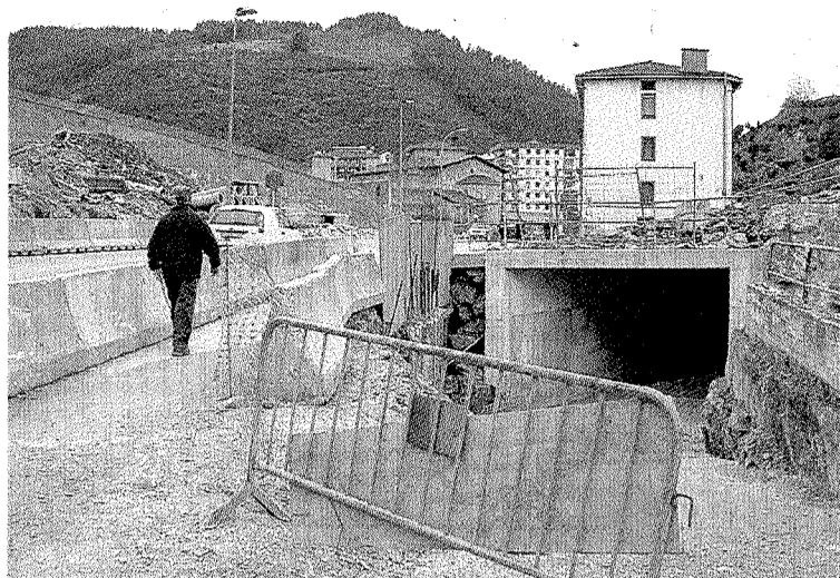
El paso subterráneo permanecía cerrado ayer por la tarde.

muy óptimo donde las piedras y el barro son las protagonistas. A pesar de eso, numerosos vecinos de ambas localidades siguen realizando ese trayecto, un recorrido que ha sufrido una nueva modificación. La semana pasada se abrió a los peatones el paso subterráneo (aunque ayer por la tarde estaba cerrado) que, cuando finalicen las obras, será el lugar por donde deban pasar los peatones para poder salvar la rotonda que se construirá en la zona. Un paso que como afirmaba el diputado general, Markel Olano, se acondicionará adecuadamente.