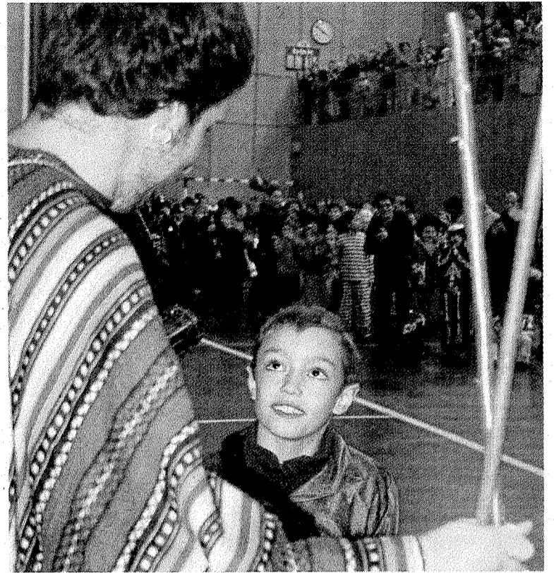
Uno de los niños ganadores de la prueba.