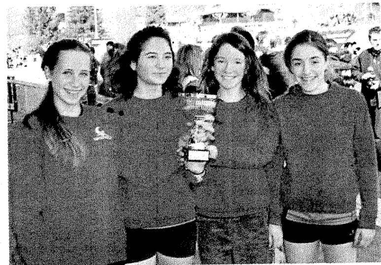
Las componentes del equipo con el trofeo logrado. ■ E. C.

Fueron terceras por equipos, algo realmente difícil, pues competían con clubes realmente potentes, y la carrera, con un día espléndido y con una afición con mucho ánimo, dio una mañana de atletismo que recordarán para siempre.