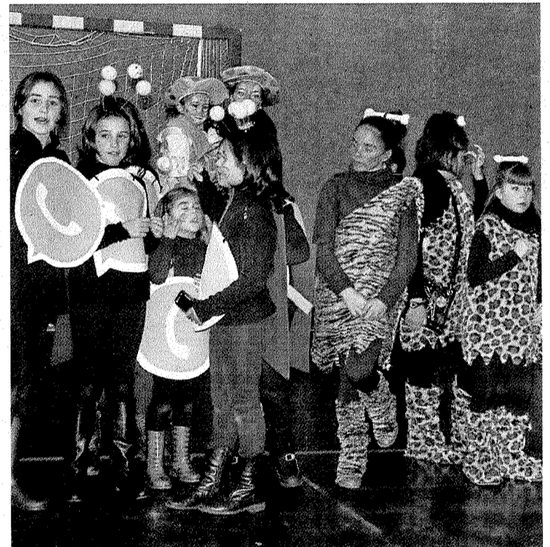
Se pudieron ver disfraces de lo más curiosos.

La tradicional fiesta de 'Hartza Eguna' cumplirá hoy 25 años en Ermua. El pasacalles comenzará a las 18 horas desde la plaza Cardenal Orbe y recorrerá diferentes zonas del municipio cantando las coplas del oso, para concluir también en la plaza.