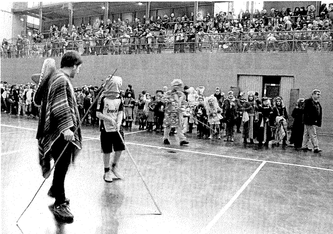
La prueba del Gallo volvió a ser la protagonista de la jornada del carnaval de Ermua.