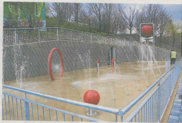
Los corporativos han visitado esta semana la instalación. •• A. L.