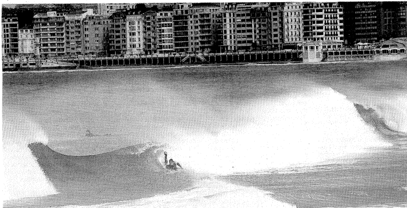
Los practicantes de bodyboard gozaron ayer con las olas en la bahía de La Concha.

Un joven de 20 años fue detenido en Erreterria por robar una bicicleta en un trastero de un inmueble de esta localidad y posteriormente tratar de venderla a un ertzaina no uniformado. Los agentes se desplazaron hasta el lugar donde el ladrón la vendía y el detenido se la ofreció por 50 euros, cuando su valor es de 375. Posteriormente, el ladrón reconoció que el vehículo era robado. EFE