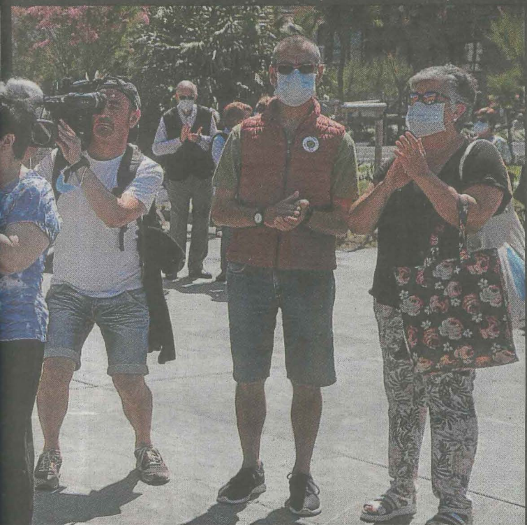
Decenas de ciudadanos guardaron un minuto de silencio en Donostia. USOZ