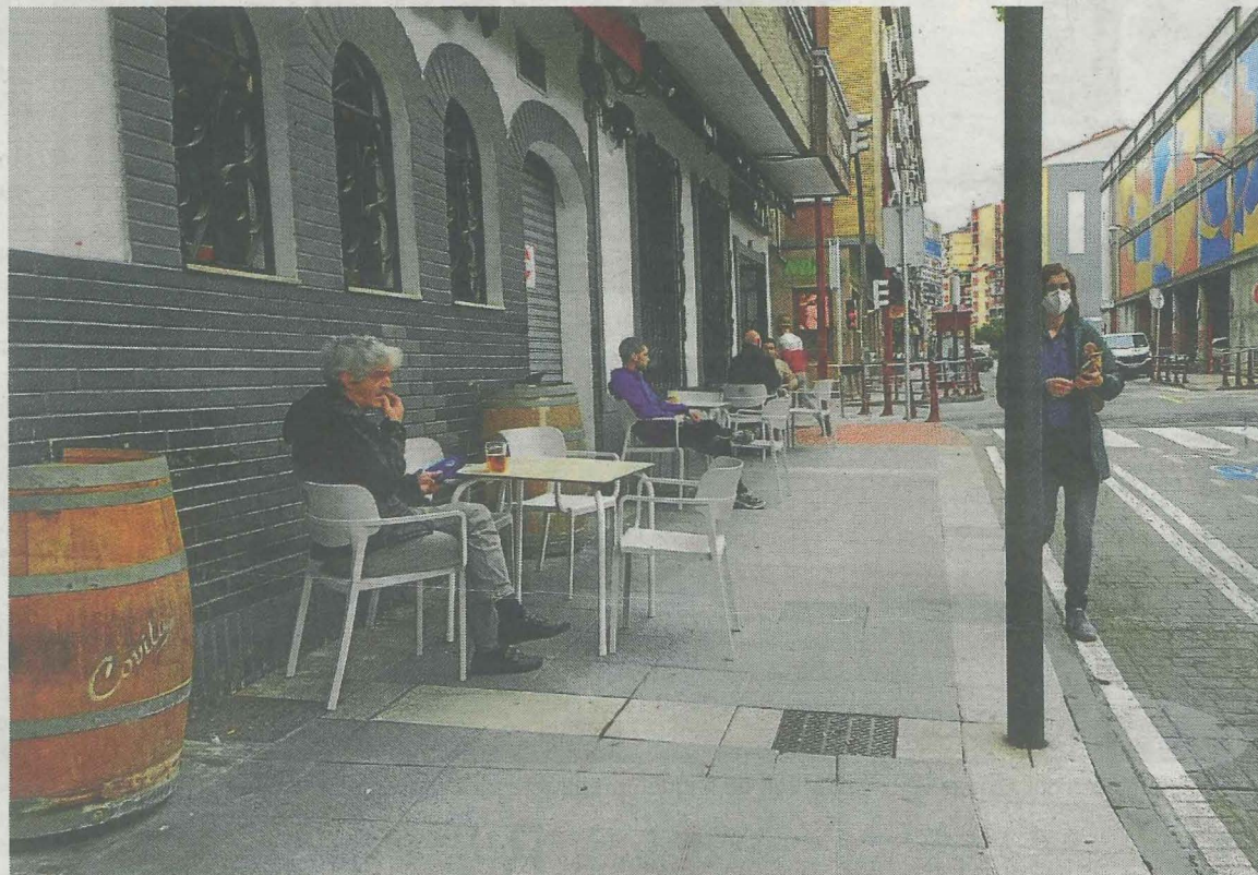
Una imagen del primer día de apertura de las terrazas, a primera hora, en Ermua.

Asimismo, una vez que los negocios puedan empezar a trabajar, «ya que no se puede trabajar al 100%», se les abone al 50% los