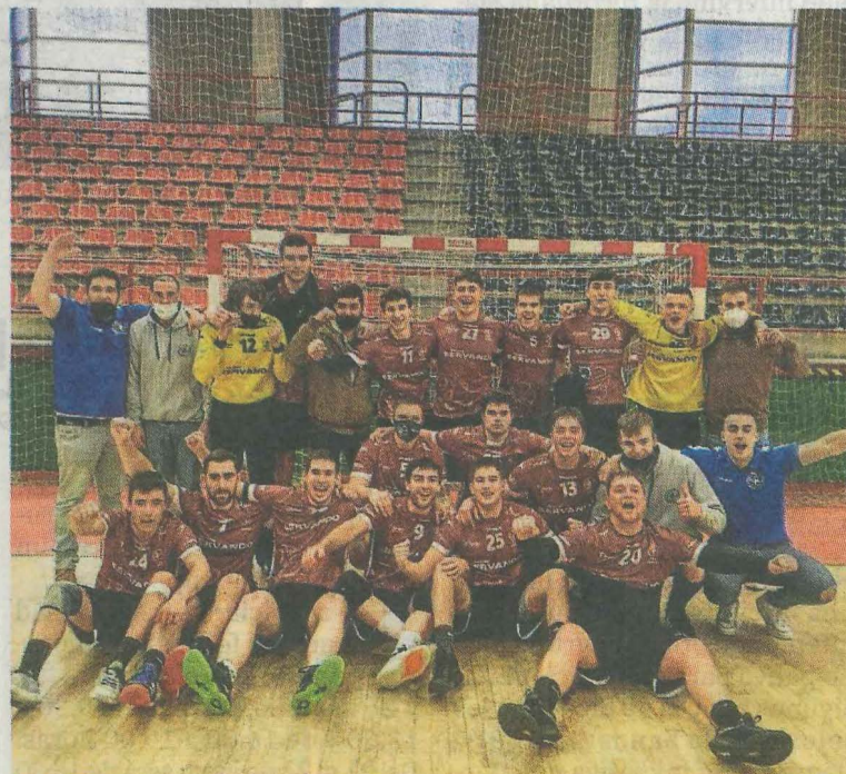
El sénior B del Hierros Servando Eibar celebra el ascenso a Liga Vasca.

moción. El juvenil femenino Grupo Mecalbe Eibar ganó 24-19 al Andu Proiektuak Orio; el juvenil masculino Hierros Servando Eibar venció 30-26 al Urnieta Guria Jatetxea; el juvenil masculino Hierros Servando Eibar perdió 25-23 cob el Deca Elgoibar; el cadete femenino Grupo Mecalbe Eibar perdió 23-22 con el Sinergia Orio; el cadete femenino Grupo Mecalbe Eibar cayó 23-28 con el Sinergia Orio; el cadete femenino Grupo Mecalbe Eibar perdió 24-21 con el Neolith Orio y el cadete masculino Hierros Servando Eibar ganó 41-14 al Ordizia.