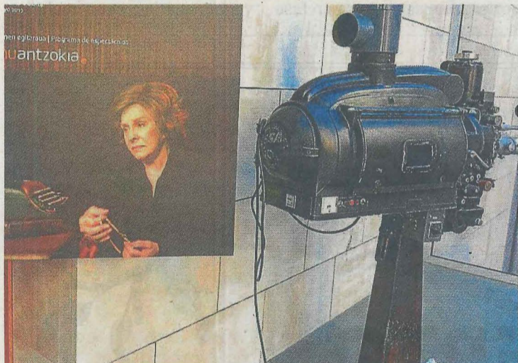
El antiguo proyector de cine adorna las instalaciones del Antzokia.