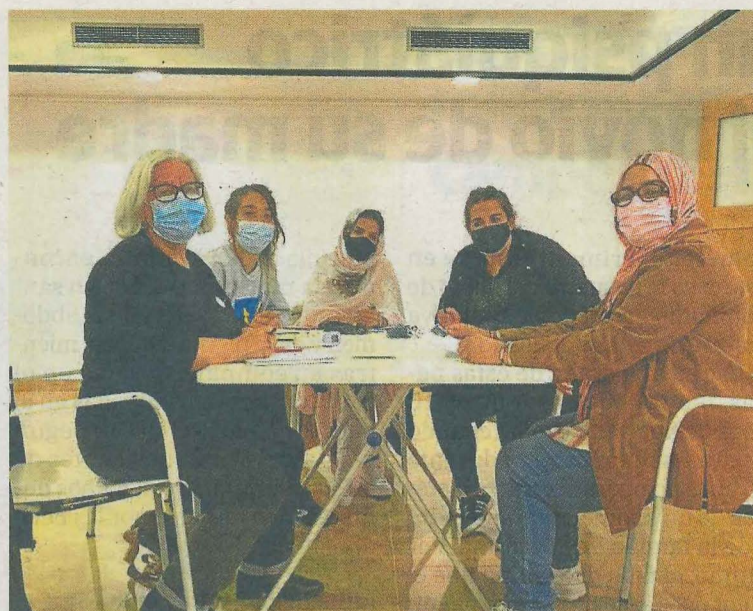
Las organizadoras de la marcha reunidas para preparar los actos. A. L.

La programación cinematográfica incluye también la cinta de dibujos animados 'Solar&Eri. Misión a la luna', una película noruega de animación y aventuras al espacio, que se podrá ver el domingo en sesión infantil a partir de las 17.00 horas.