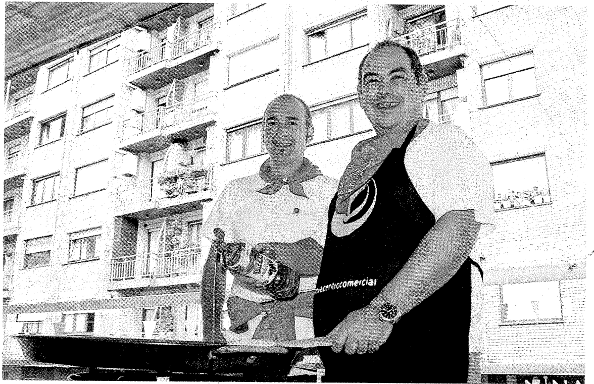
Los miembros de 'Iunbiou' en plena faena preparando su paella que luego degustaría la cuadrilla.

El que más y el que menos supo encontrar su sitio y los hubo que, como 'Zorotasun', utilizaron un tol-