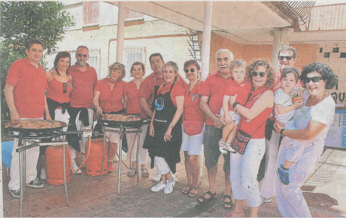
Una de las txarangas que participaron en la fiesta durante la preparación de la paella.