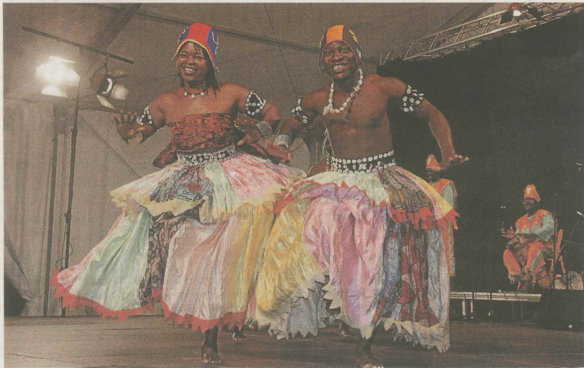
Bailes africanos con el grupo de danza Les As de Benin, en el festival de hace cuatro años.