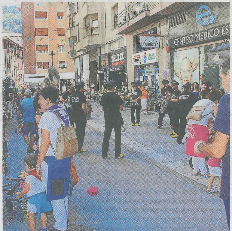
Una de las fanfarrias ambientando las calles durante la jornada.

El ambiente continuó con la música en las calles y en la plaza y con los fuegos artificiales que contaron con numerosa asistencia. Después, los más animados que fueron muchos, cerraron las fiestas con el concierto de Elsa Baeza.