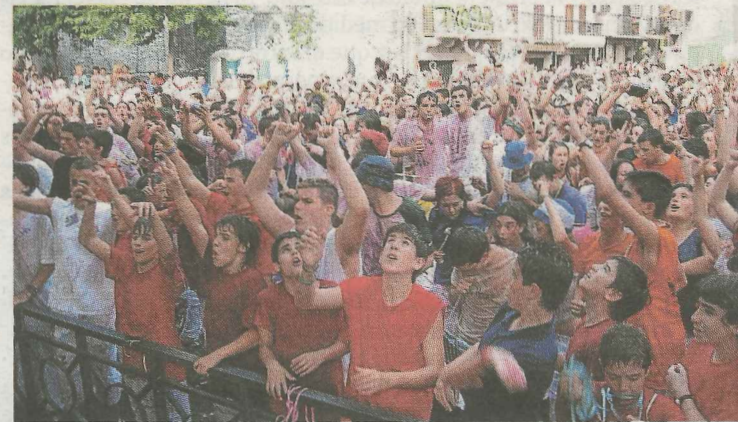
El sol no brilló para el txupinazo, pero la fiesta no decayó.

Paellas, sardinas, verbenas, fuegos artificiales y conciertos se despiden con las fiestas dejando un buen sabor de boca y dando paso, en muchos casos, al inicio de las vacaciones de verano.