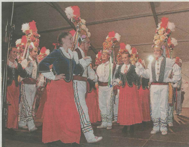
Baile a cargo de Gure Kai Dantza Taldea.