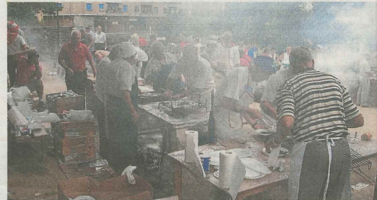
Gente de todas las edades ha participado en las fiestas.