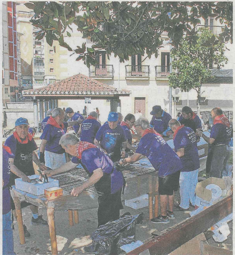
Los jubilados volvieron a preparar y repartir sardinas este día.