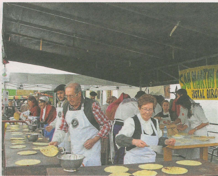
La Feria de San Martín reúne a población de todas las edades. A.L.

Se ofrece una ayuda de hasta 90 euros por estudiante.