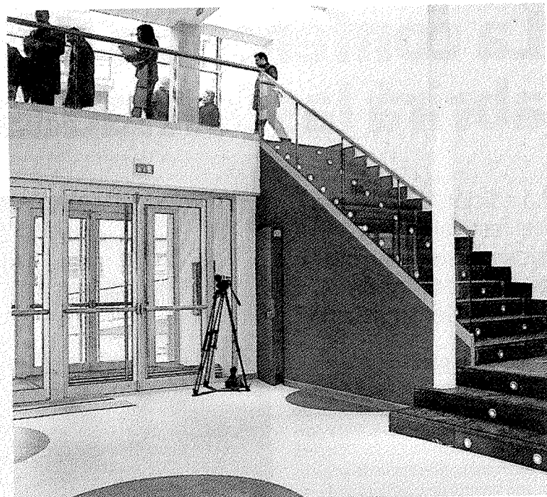
Los medios de comunicación visitaron las nuevas instalaciones.