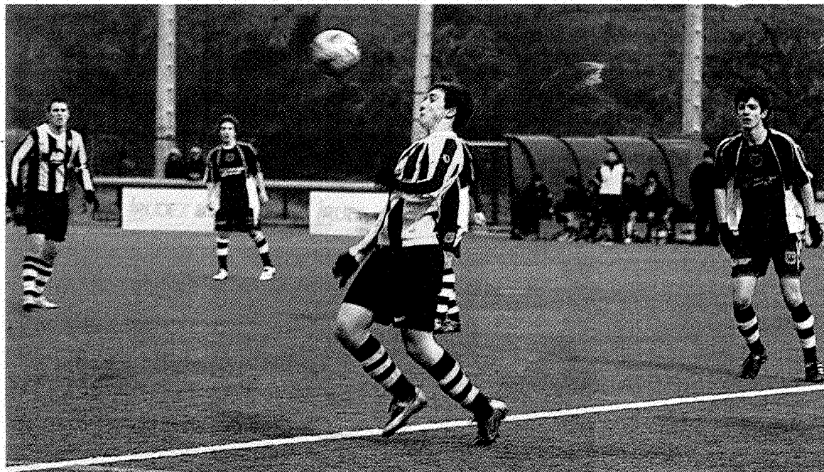
El Amaiak juvenil se medirá al Añorga esta jornada.

Los infantiles, después de completar una espectacular primera fase, se han encontrado con una Fase de Campeones durísima. De hecho, son el único equipo que todavía no ha puntuado y va último. Esta semana se enfrenta a un Bergara que está cómodamente en mitad de la tabla.