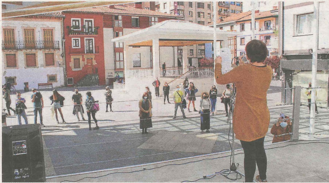
El público asistente posó al final del acto para una foto de grupo en la plaza Cardenal Orbe. A. L.

Basagoiti se encargó de recordar al público presente que «zuei eskerrak mantenduko da piztuta euskararen garra... Horretarako derrigorrezkoa da euskaltegien indarra» («gracias a vosotros y vosotras se mantendrá viva la llama del euskera... Para ello es imprescindible la fuerza de los euskaltegis»).