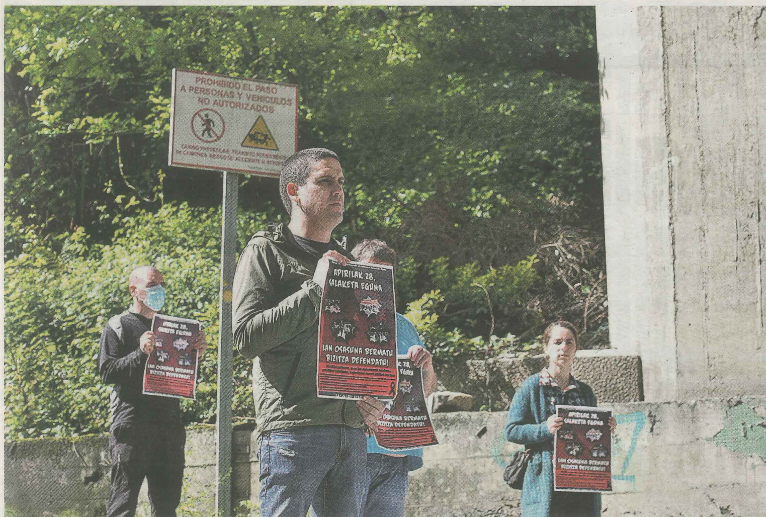
Zaldibarko zabortegearen sarreran egindako protesta, atzo.