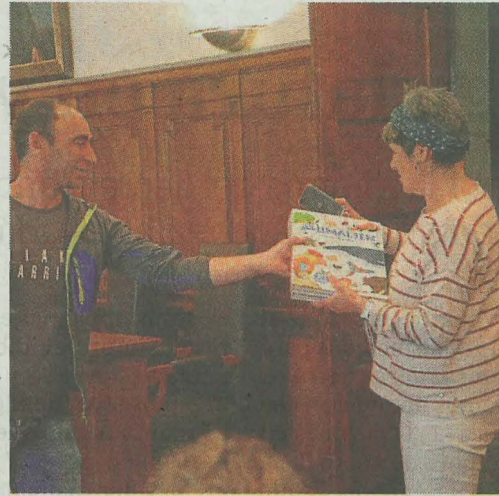
Udalak bí liburu eskaini zien eskolari.