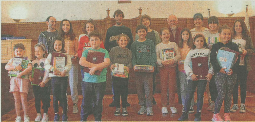
Ipuin eta ilustrazio sari banaketa saritu guztiak.