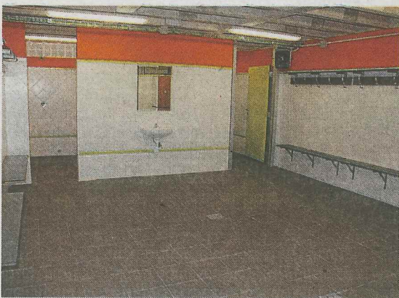
Los vestuarios también se han mejorado.