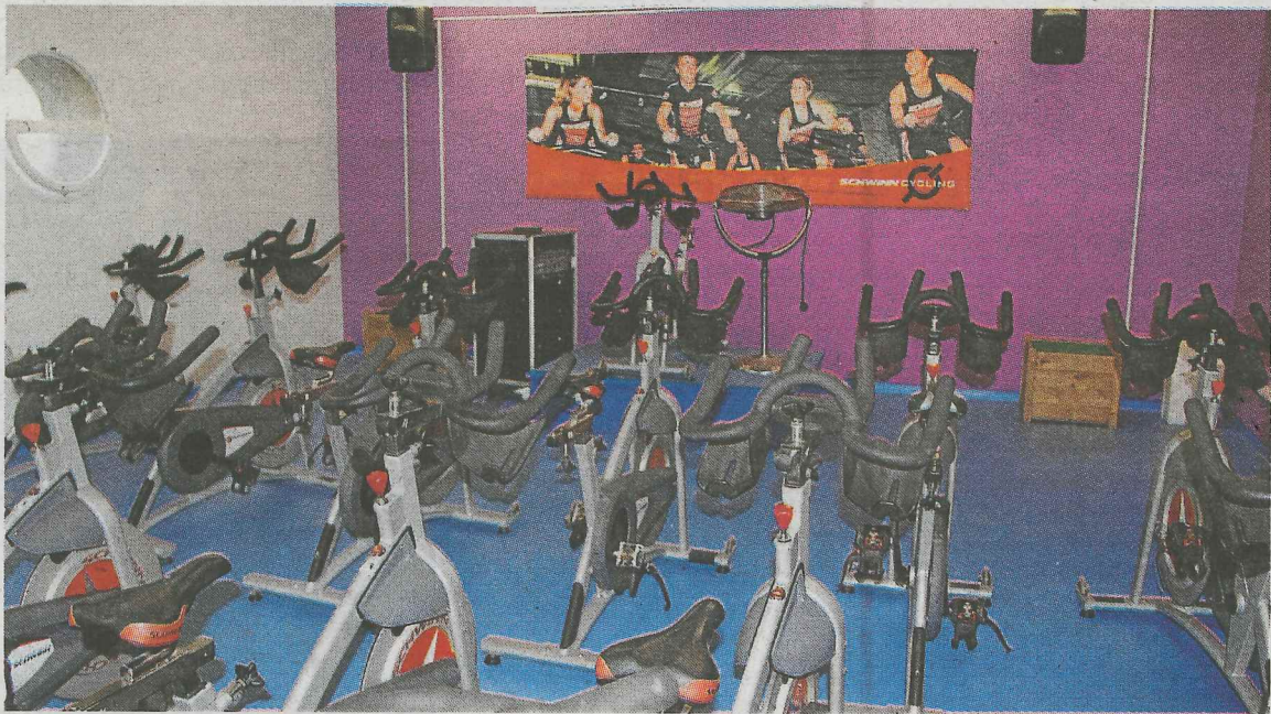
La sala de 'cycling' cuenta ahora con más sitio para la práctica y 30 nuevas bicicletas.

La remodelación del polideportivo se ha llevado a cabo con dinero del Ayuntamiento de Deba y el Departamento de Deportes de la Diputación de Gipuzkoa. El ente territorial ha aportado 500.000 euros