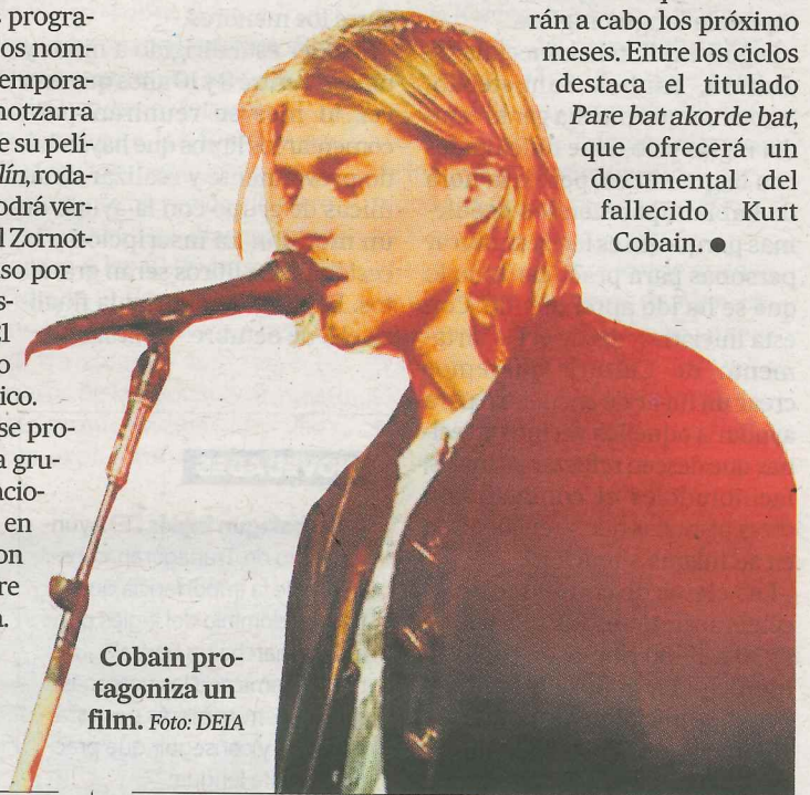
Cobain protagoniza un film.

ZINEKLUBA Como viene siendo habitual, tampoco faltarán los espectáculos de danza, actuaciones musicales de pequeño formato en Zelaieta. Además, el espacio volverá a contar con el grupo zornotzarrá Kine Zinekluba para diseñar los tres ciclos de cine temáticos que se llevarán a cabo los próximos meses. Entre los ciclos destaca el titulado Pare bat akorde bat , que ofrecerá un documental del fallecido Kurt Cobain. ●