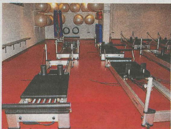
La nueva sala de pilates en el polideportivo.

para acometer estas reformas. Estos trabajos se han realizado en un plazo de nueve meses.