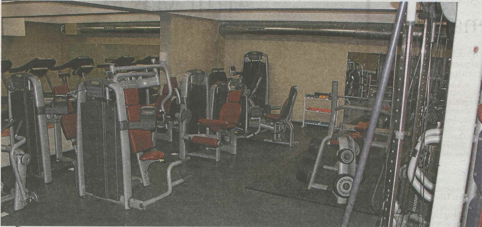
En el polideportivo se han colocado máquinas modernas para ejercicios de musculación.