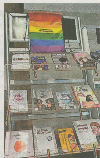
Expositor en la biblioteca. AYTO

La entrada al festival es gratuita, y la zona contará con txosnas para bebidas. El festival está organizado por Elektrojaia Taldea, con la colaboración del Ayuntamiento de Ermua y marcas patrocinadoras del evento.