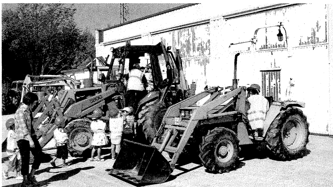
La Escuela de Maquinaria, durante una visita de escolares a sus instalaciones.