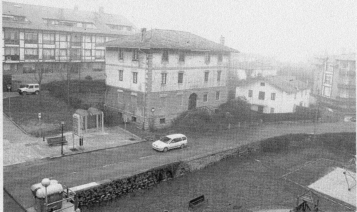
Vista general de Mungia Bidea, donde se mejorará la seguridad y la accesibilidad.

También forman parte del proyecto la ejecución de los muros que resultan necesarios, la instalación de las redes de servicio, la pavimentación de aceras y calzadas, la señalización vertical y horizontal, el mobiliario urbano, la jardinería y la reposición de los cierres de fincas afectadas por las obras. En este sentido, han sido necesarias cesiones de terreno por parte de comunidades de propietarios. Los vecinos han llegado a un acuerdo con el Ayuntamiento, salvo en un caso, por lo que, tal y como aprobó el pleno el pasado martes, se iniciará con urgencia el