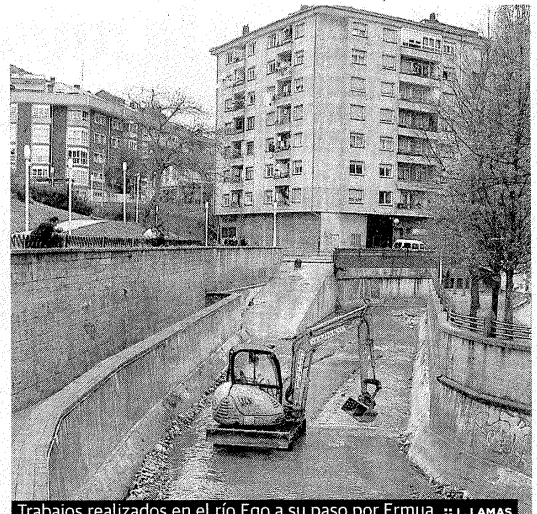
Trabajos realizados en el río Ego a su paso por Ermua.