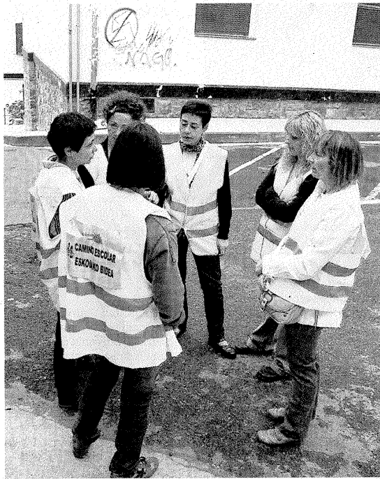
Colaboradoras del Camino Escolar de Eskola-Berri. ■ A. L.

El proyecto dota a los niños de autonomía y responsabilidad, contribuye a disminuir el tráfico incentivando desplazamientos menos contaminantes, ayuda a combatir la contaminación atmosférica y acústica del pueblo, favorece la relación entre la ciudadanía y la administración y contribuye al ejercicio diario que necesita un buen estado de salud, ya que tan importante como la alimentación es el ejercicio físico.