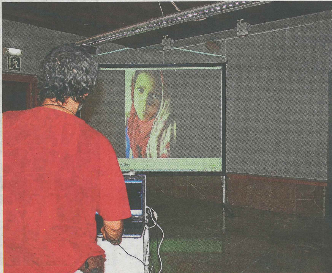
Imagen de la proyección en Ermua de un documental sobre el Sahara.

Desde el Ayuntamiento de Ermua instan al Gobierno español a cumplir con su responsabilidad para poner fin al proceso de descolonización del pueblo saharauí, inconcluso desde 1975, mediante la celebración de un referéndum que asegure