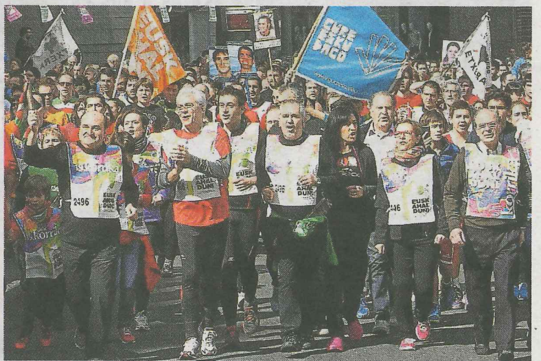
El presidente del EBB, Andoni Ortuzar, porta el testigo junto a la comitiva del Ayuntamiento de Bilbao encabezada por Ibon Areso.