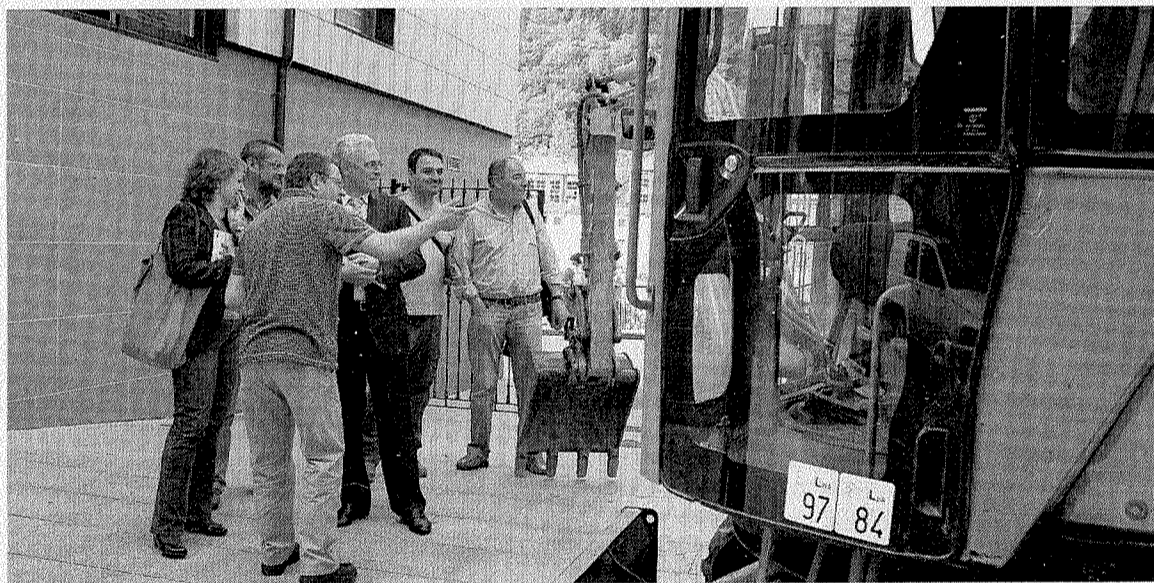
Responsables de la Escuela, el alcalde y la directora de Osalan observan las máquinas expuestas. •• A. L.

Los asistentes al Foro eran los estudiantes 'Coordinadores de las Comisiones Ambientales' que ya todos los centros escolares de Ermua poseen. Los escolares de primaria han abordado la vertiente del ahorro de recursos (energía y agua) y la mejora en la recogida selectiva de residuos. Los de secundaria, por su parte, han analizado y realizado encuestas sobre los hábitos de consumo de los ermuares y la posibilidad de comprar o no en el municipio, por ejemplo, productos de origen ecológico de productores cercanos.