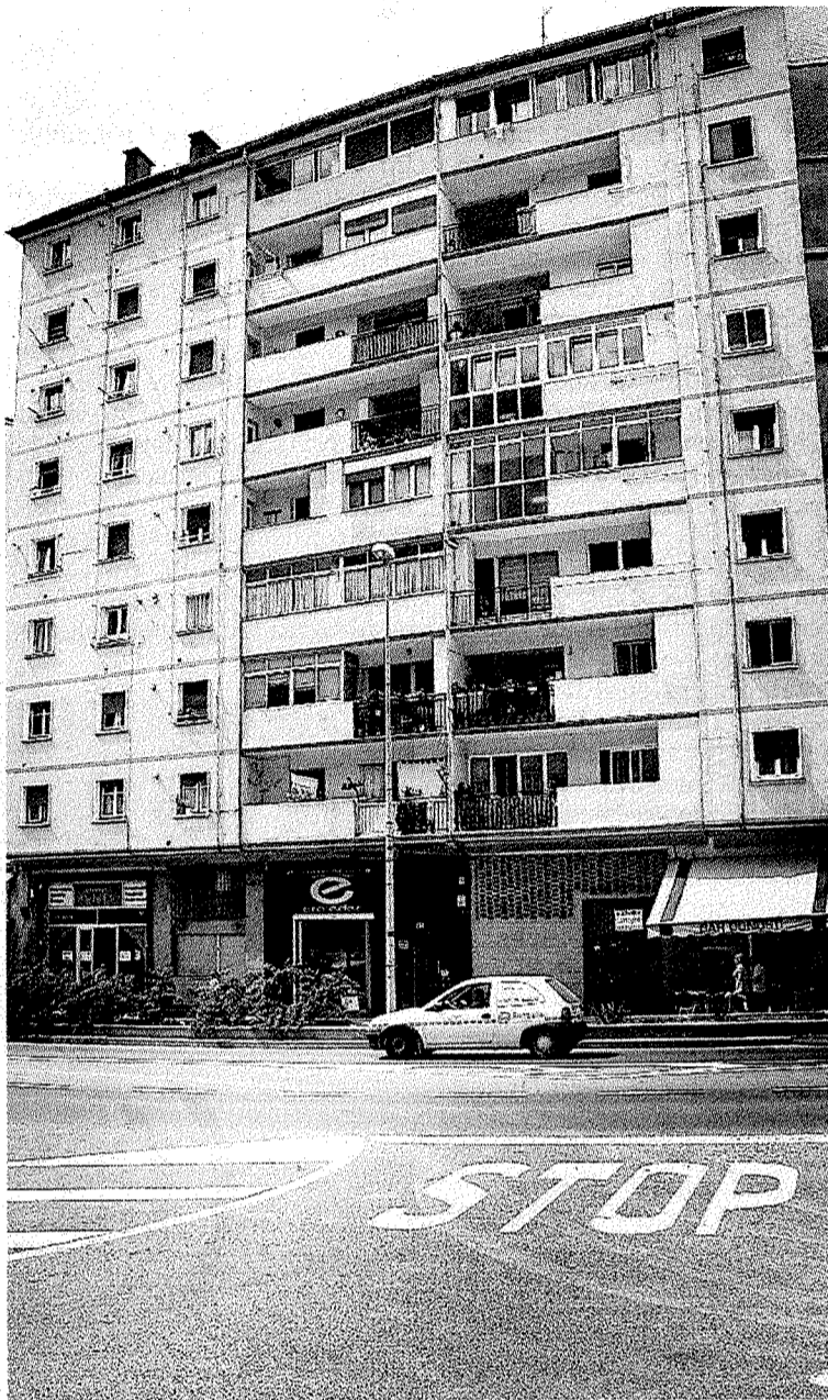
La mujer amagó con tirarse desde el sexto piso.

No ha sido esta la primera vez que ha ocurrido un suceso fuera de lo normal en esta vivienda. «Han sido pocos, pero muy sonados», explicaba uno de los vecinos, para aclarar que la conflictiva pareja lleva-