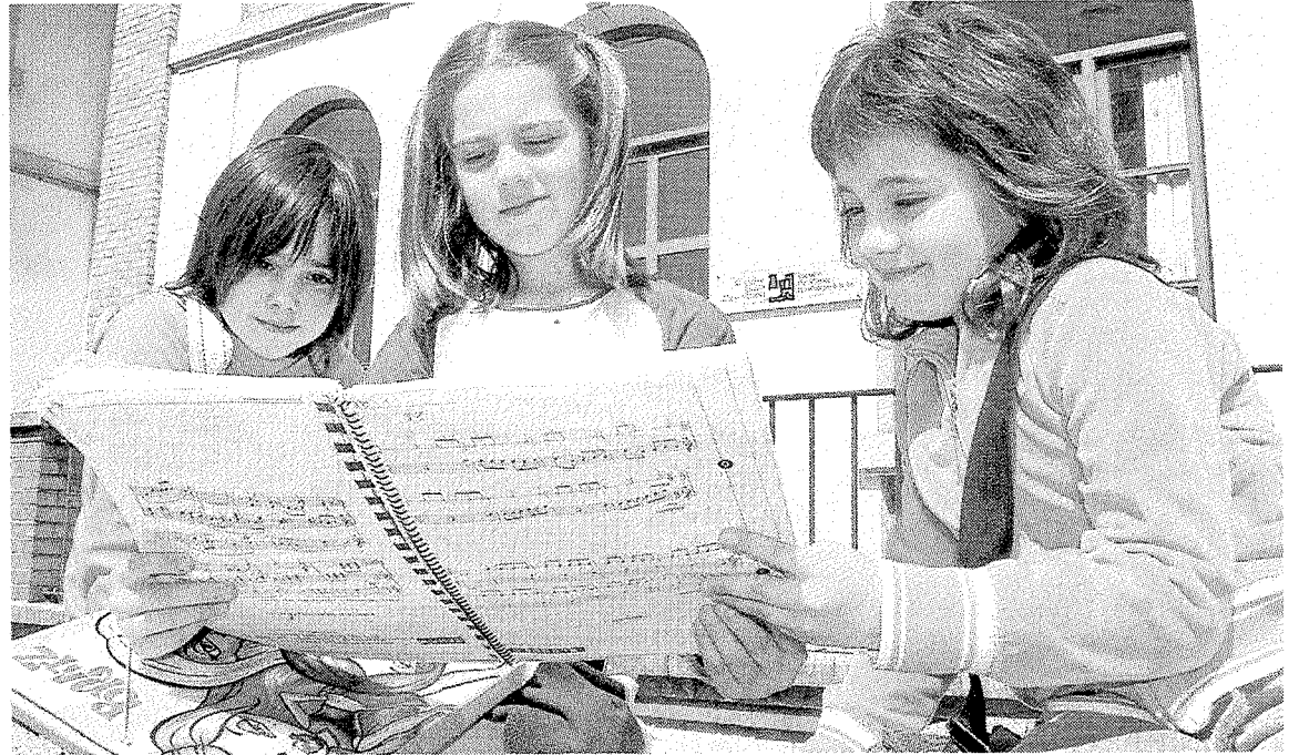
Imagen de archivo en la que unas niñas ojean una partitura junto a la escuela de música.