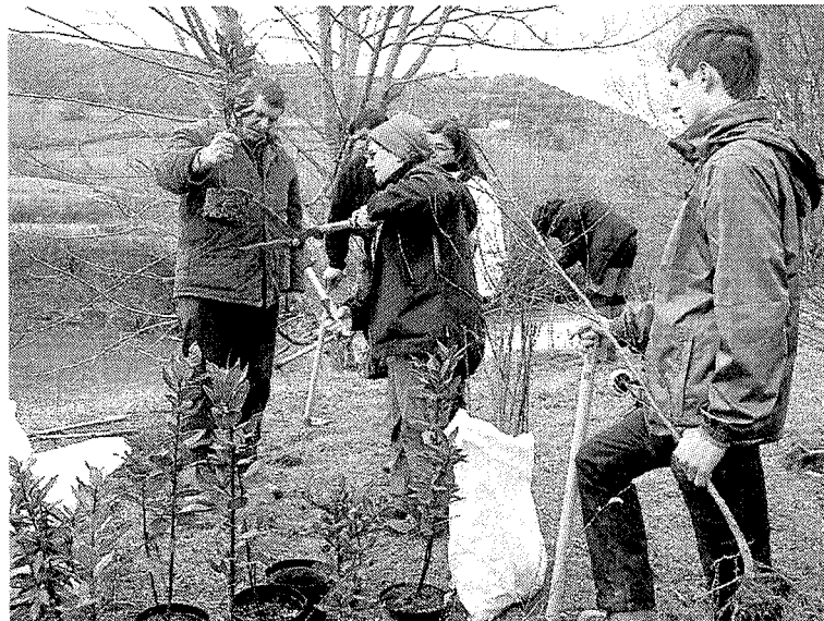
La actividad ya se llevó a cabo el 16 de marzo en Orduña.

Los participantes también realizarán, a lo largo de la mañana, una limpieza y recogida de residuos en la zona. La duración estimada de la jornada es de tres horas y con-