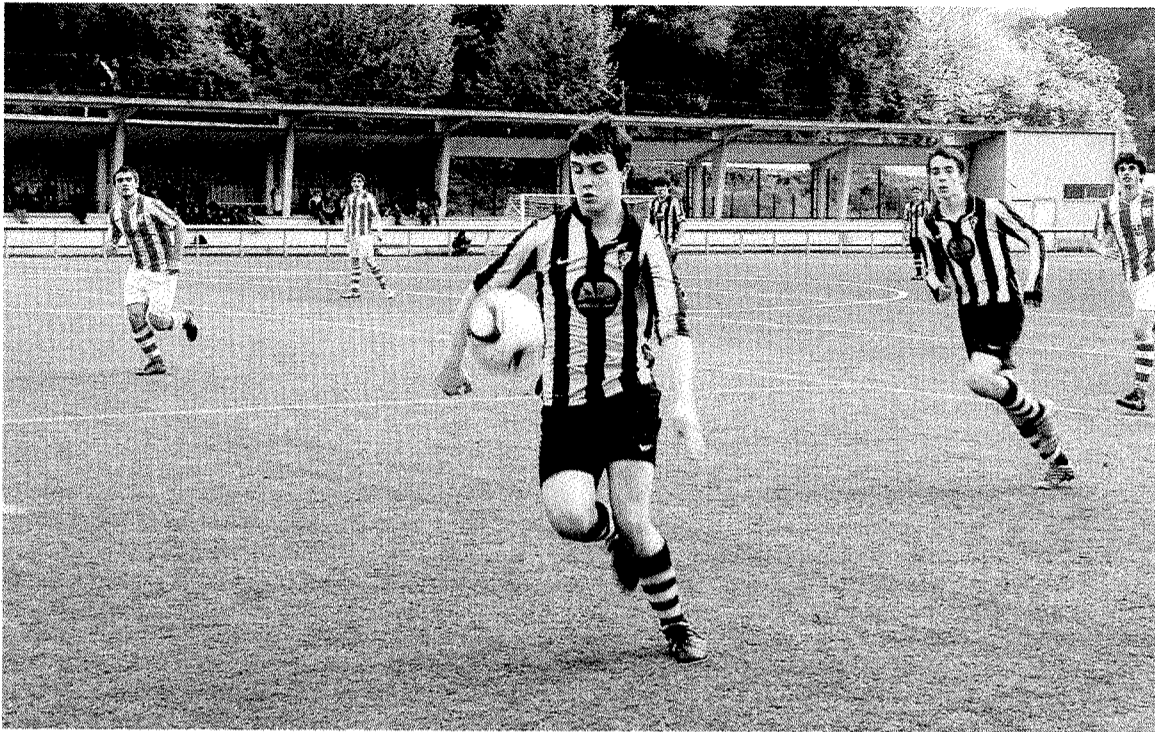
Los juveniles ganaron al Beasain en un bonito partido, disputado en Errota Zar. :: ANDER SALEGI