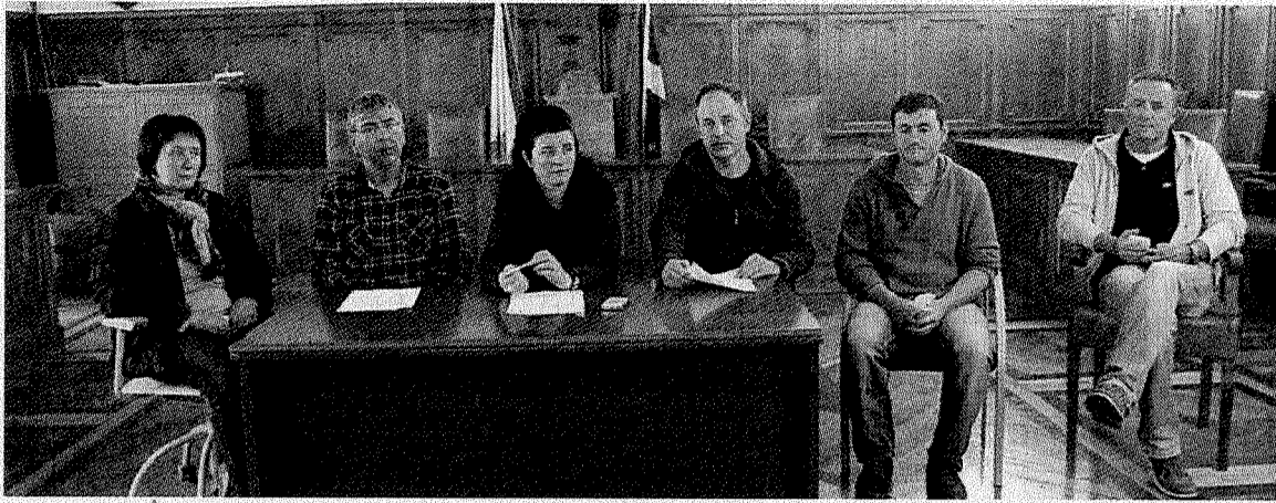
Representantes de Alternatiba, Aralar e IHS.