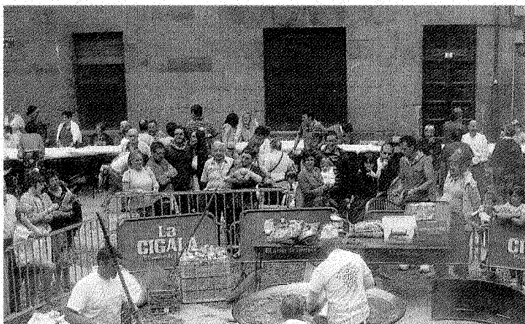
Durante las fiestas del pasado año, haciendo la paella popular.

Al día siguiente, el sábado 17, a partir de las 12.00 horas, habrá gigantes y cabezudos, amenizados por los gaiteros de Iparralde. A la una del mediodía se hará una exhibición de la preparación de la paella que será el plato principal de la posterior comida popular. El precio de la comida es de 10 euros para los adultos y de 5 para los niños. Para poder disfrutar de la