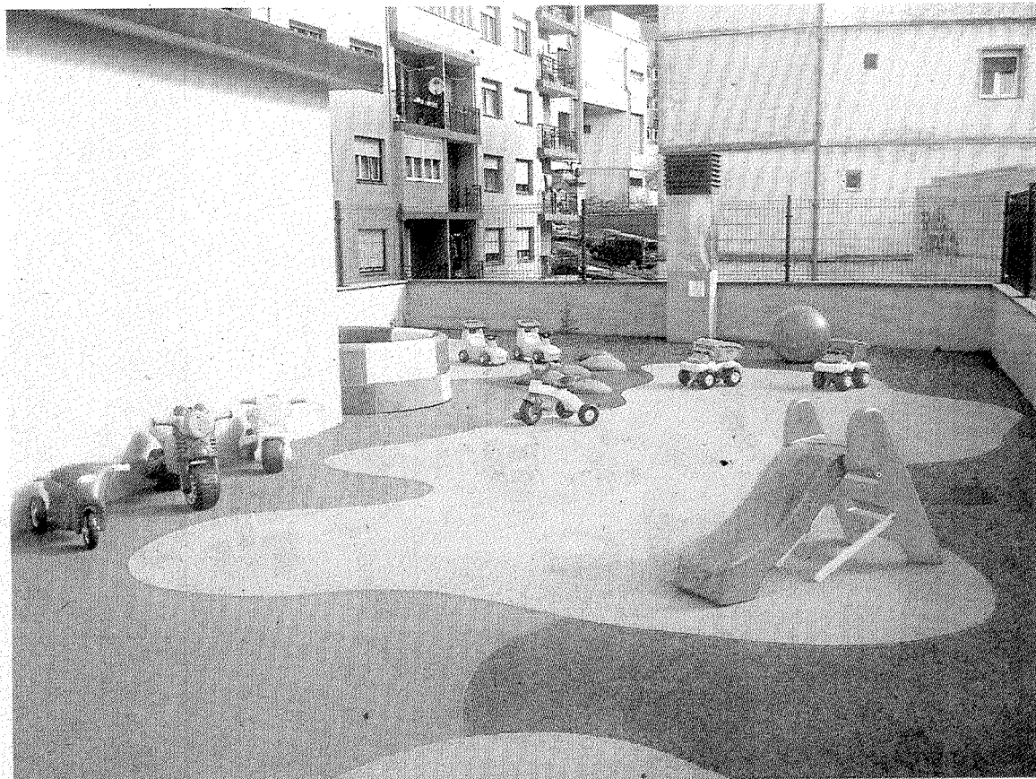
Instalaciones del patio descubierto en el que juegan los pequeños asistentes al servicio.

El primer mes (10 días de adaptación) tendrá un precio más económico, que se abona en la matrícula. En los precios se incluye el servicio de comedor, en el que no se elaboran alimentos sino que se calienta y se da de comer lo que se trae desde cada casa.