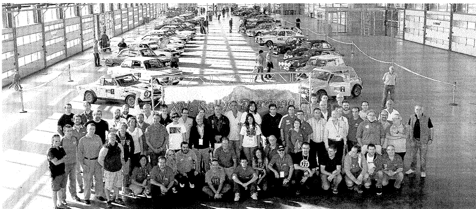
Participantes y organizadores del Rally Clásicos de Durango posan antes de partir el sábado de Landako Gunea.