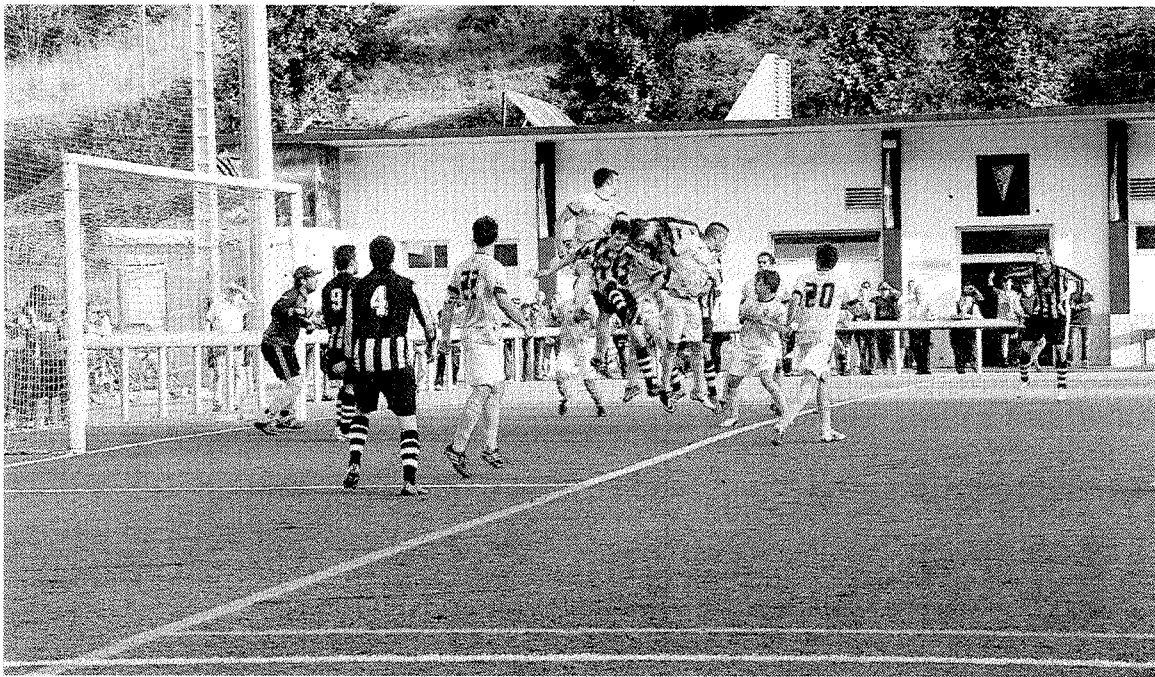
Jugada del tercer gol del Amaikak para conseguir la victoria ante el Aretxabaleta.