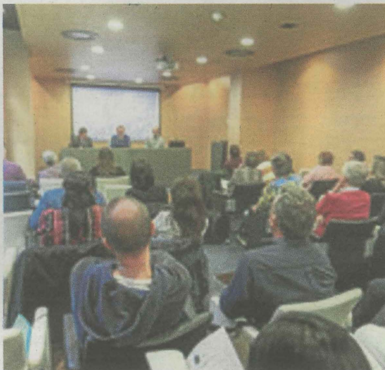
Una de las reuniones del 'gobierno abierto' de Ermua. :: WEB MUNICIPAL

El sistema vasco de integridad se plantea como un sistema integral de ética pública y buen gobierno que