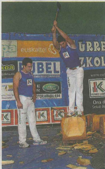
Saralegi izango da lehian. :: A.S.

Ardi eta ahuntzei dagokionez, Euskal Herriko IV. Sasi ardi txapelketa eta sari-banaketa egingo da, 15 ukuilu ezberdinetako ardiekin. Bestalde, Gipuzkoako V. Ahuntz azpi-