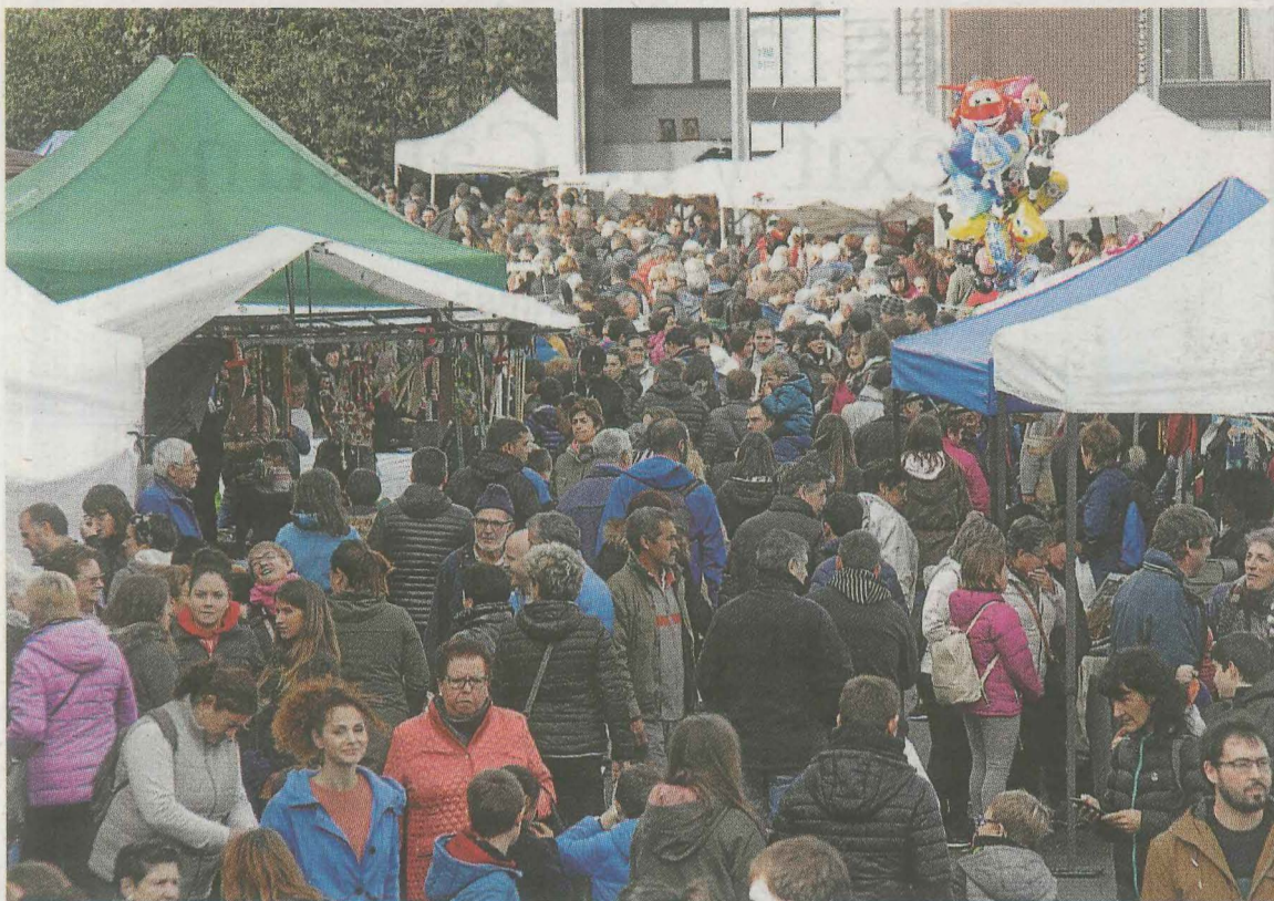
Jendetza bildu ohi du azaroaren 1ko periak Itziarren.