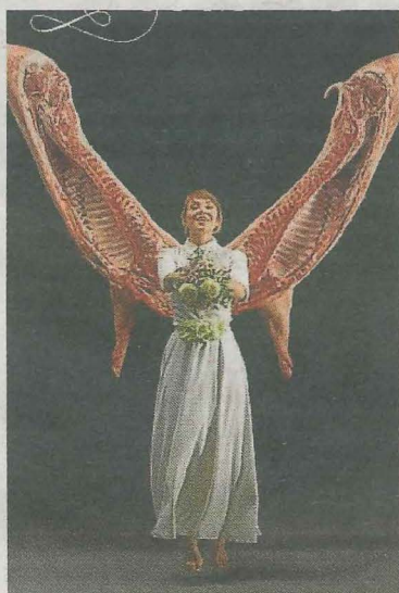
Representación de 'Txarriboda'..

Para disfrutar en familia también se podrá preparar un zumo de frutas con diferentes mezclas, crear su propio instrumento o incluso se organizará un taller de reconocimiento «para que los padres y madres puedan regalar unas palabras de reconocimiento de sus méritos y cualidades a los hijos e hijas, o les puedan informar de lo que han aprendido gracias a ellos y ellas, que habitualmente se olvida en el día a día».