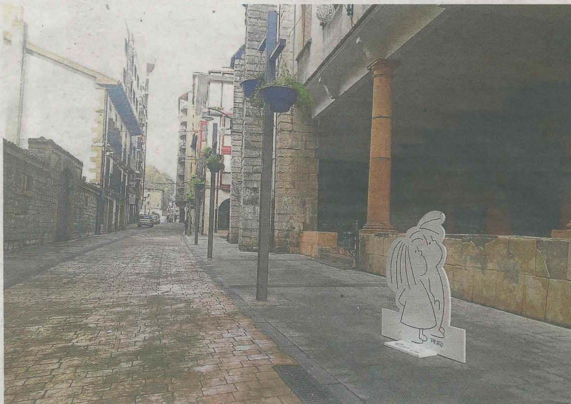
Una de las figuras presentes en las calles de Ermua por la iniciativa 'Ciudad Educadora'.

En el espacio que se utilice para desarrollar las actividades se podrá encontrar una zona de juego libre.