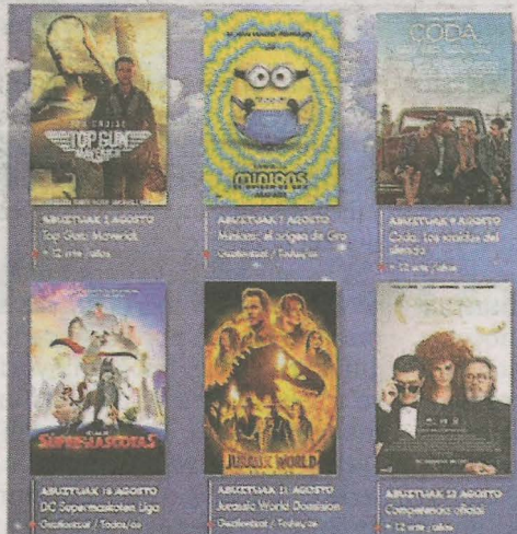
El cartel presenta varias de las propuestas cinematográficas del mes.

'Coda. Los sonidos del silencio' será la tercera propuesta cinematográfica para este verano. Se proyectará el día 9 de agosto. Este drama sobre la discapacidad, del director Siân Heder, con un elenco protagonista compuesto por Emilia Jones, Troy Kotsur y Marlee Matlin, obtuvo tres premios Oscar en 2021 (mejor película, guion adaptado y actor secundario, con Troy Kotsur). Cuenta la historia de Ruby (Emilia Jones), que es el único miembro oyente de una familia de sordos. Ella es