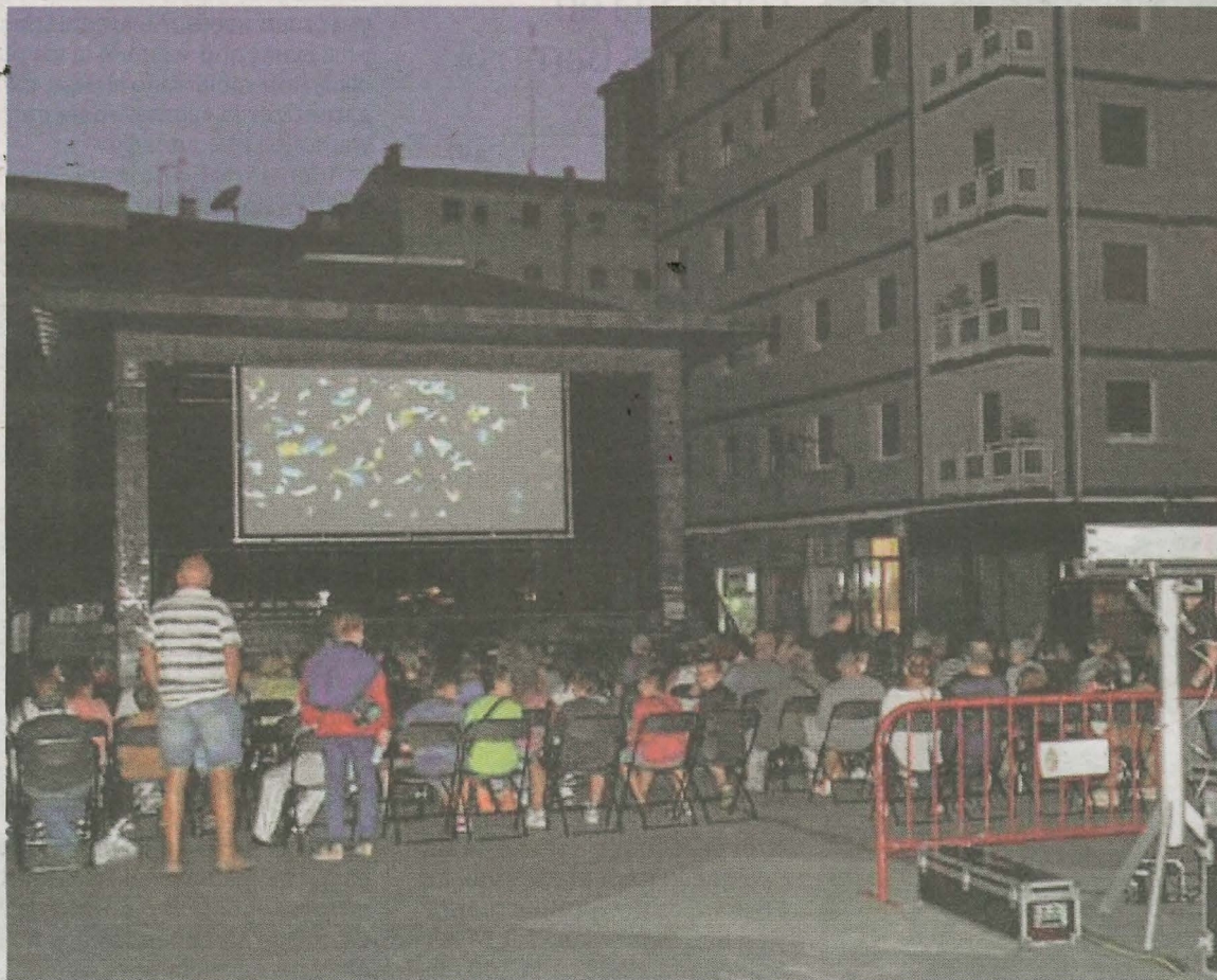
Las proyecciones se ofrecerán en la plaza, a partir de las 22.00h.

El día 7 se proyectará la película de animación 'Minions: The Rise of Gru', dirigida por Kyle Balda, Brad Ableson y Jonathan del Val. Esta comedia de cine familiar cuenta con los divertidos personajes en una secuela que se desarrolla en los años 70, en los que