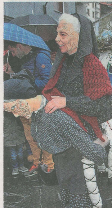
No faltarán los disfraces. A. L.

Por un lado, se celebrará una discoteca infantil con disfraces y photocall en la plaza Cardinal Orbe. Esta se iniciará a las 17.30 horas y concluirá a las 20.30 horas.