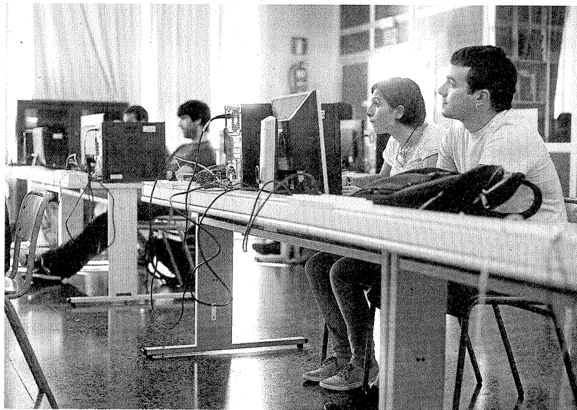
Alumnos de Armeria Eskola encuentran empleo en el extranjero y en la comarca. FÉLIX MORQUECHO

En este sentido, también se valora que «este interés de las empresas evidencia el grado de prestigio logrado por Armeria Eskola, por los estudios que se prestan y la continua formación en prácticas».