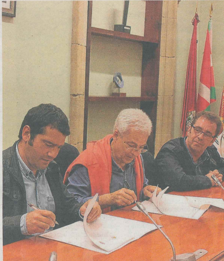
Acto de firma del convenio entre Ermua y Mallabia.

Este trabajo de colaboración entre ambos municipios y que se ha desarrollado gracias a un convenio firmado entre ambas localidades pretende aportar a la población mallabitarra una mejor conectividad y a Ermua captar un mayor número de clientes en la fibra óptica municipal.