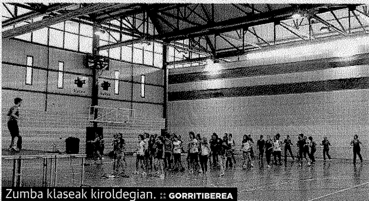
Zumba klaseak kiroldegian. GORRITIBERIA