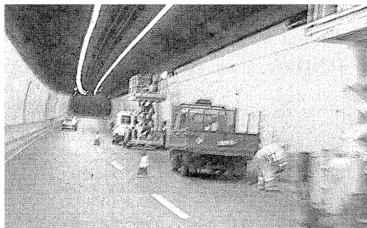
Imagen de archivo de trabajos en el túnel de Malmasín.

● Estructuras. De las once estructuras principales proyectadas, las más importantes son los tres viaductos para el enlace con la autopista y el paso bajo el ferrocarril en la rotonda de Uretamendi Sur.