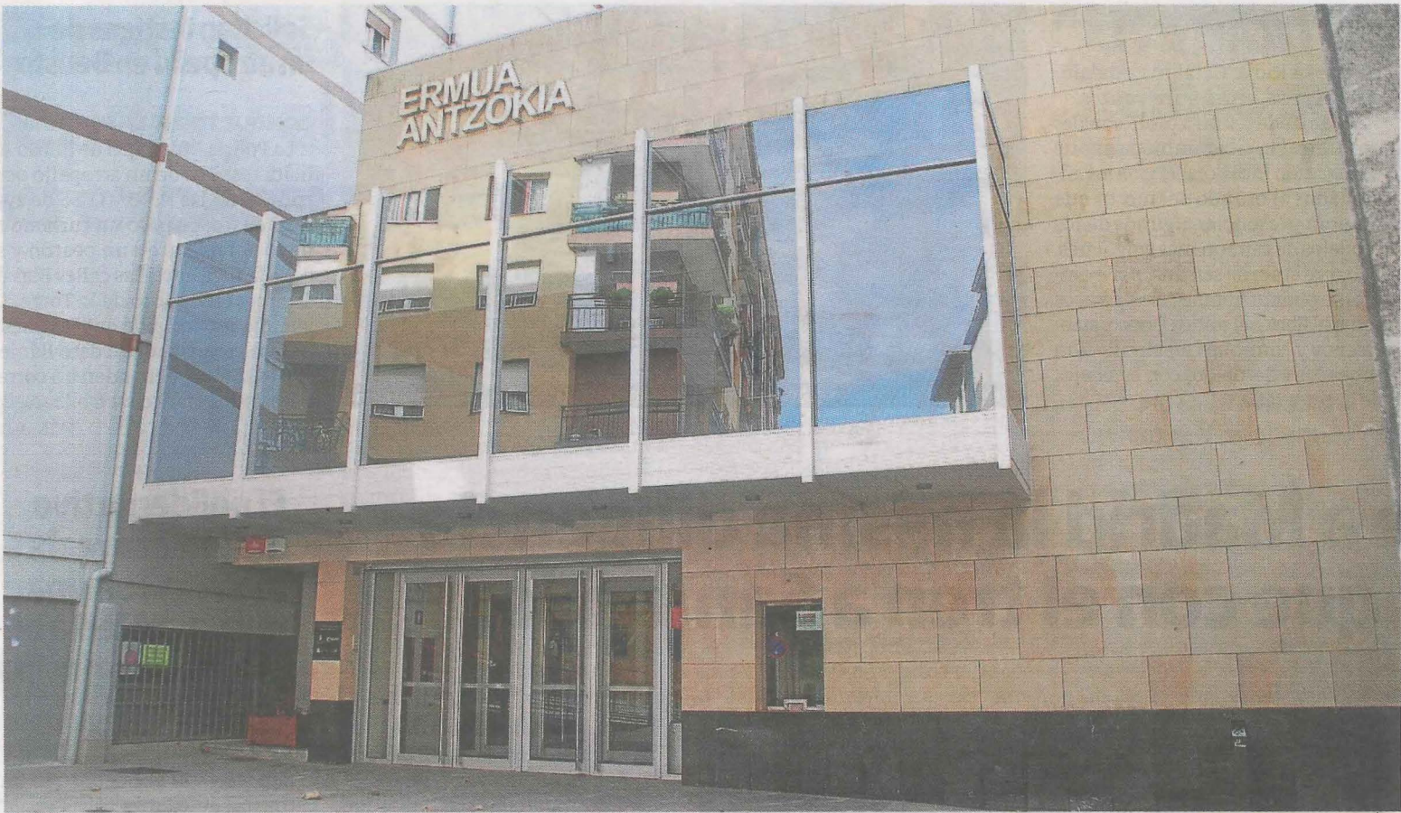
Ermua Antzokia acogerá varias de las actividades programadas para el mes de septiembre. ** E. G.