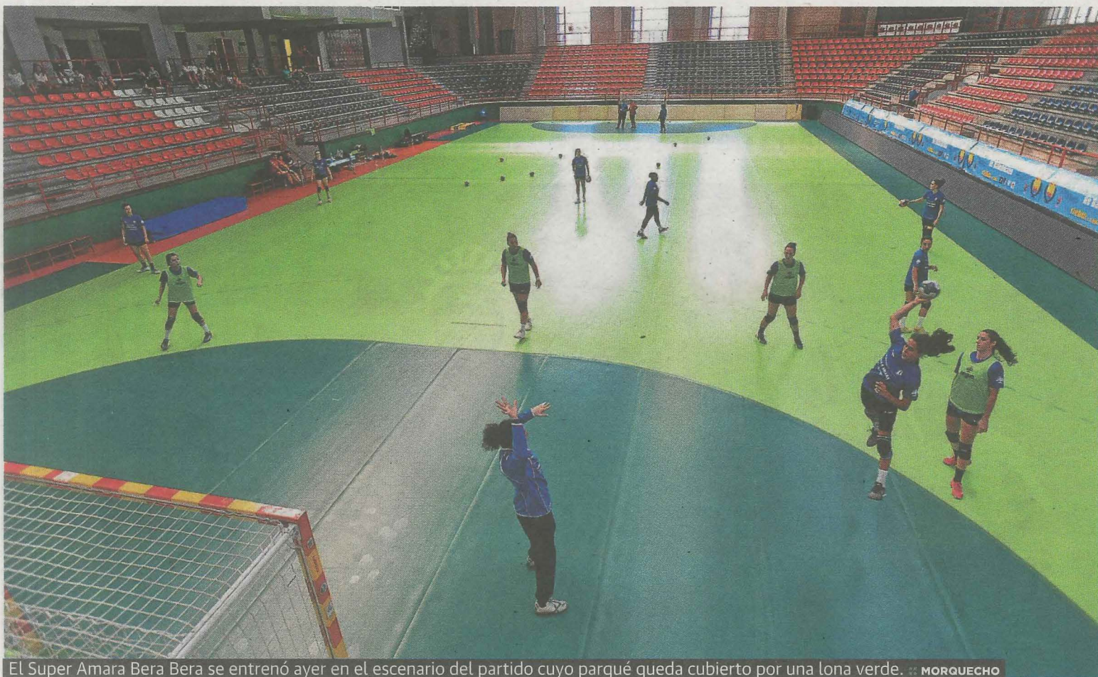
El Super Amara Bera Bera se entrenó ayer en el escenario del partido cuyo parqué queda cubierto por una lona verde. :: MORQUECHO

Bera Bera-Rocasa, hoy en Ipurua a las 18.15 horas