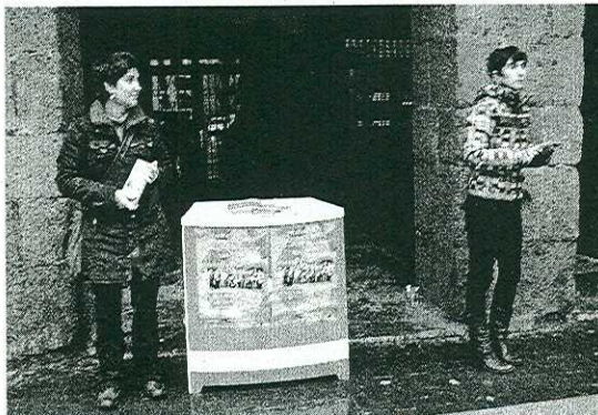
Miembros de la Escuela de la Experiencia en Soraluze.

Pérez de Albéniz mostró su satisfacción al ver que por primera vez un vecino de Soraluze se inscribía en la escuela. Se trata de una persona de 62 años de edad. En los cinco años que lleva funcionando, la Escuela de la Experiencia de Debabarrena nunca había contado con ningún alumno de nuestro municipio.