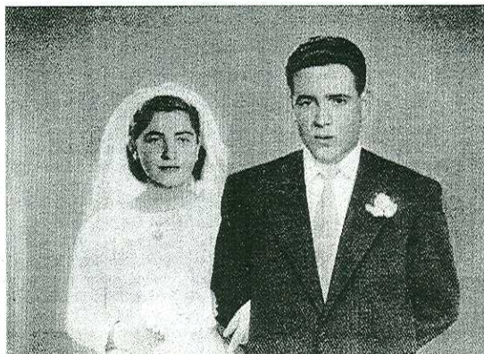
HACE 50 AÑOS. La pareja, el día de su boda.

Allí han residido durante este tiempo y allí se han criado sus cuatro hijos. Ellos, sus vástagos, fueron ayer los testigos de la 'nueva' boda de sus padres. Decidieron celebrar esta ocasión especial en el lugar original, en Eibar, y por eso montaron una fiesta que tuvo varios escenarios.