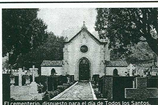
El cementerio, dispuesto para el día de Todos los Santos.

'Gaba Beltza 2008' egitarauko lehen ekintzak gaur ospatuko dira. Lehenik arratsaldeko 19:30etan abiatuta ibilaldi beldurgarria izango dute lehen hezkuntzako ikas-