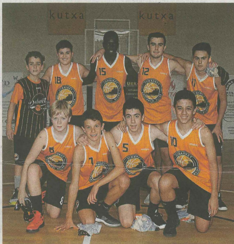
Debasket Urkunde taldeak garaipena eskuratu zuen.

Electricidad Perosanz senior taldeak etxeko emaitza bolada onari jarraipena eman zion. Partida zaila aurreikusten zen Donostiako Atlético San Sebastián taldearen aurka. Debarrek hasieratik erritmo lasaia eta taula azpiko nagusitasuna inposatu nahi izan zuten. Donostiarrek berri erritmo altuko partida proposatu zuten, kontraerasoan ateraz aukera zuten bakoitzean. Lehen laurdena berdinduta joan zen, etxeko taldeak hiruko marrik asmatzeaz gain taula azpian saskiratze errazak lortzen zituen. Aurkariak kontraerasoan min egiten zuten berriz. Ez zuen Debasketek arazo handirik donostiarren kantxa osoko presiotik ateratzeko. 24-17ko emaitzarekin bukatu zuen lehen laurdena. Bigarren laurdenean partidak antzeko gidoia jarraitu zuen. Kontrolpean zuela partida Debasketek ematen zuten baina presiotik ateratzeko garaian hartutako erabaki txar batzuek donostiarrei markagailuan hurbiltzea ahalbidetu zien. Entrenatzaileak hitsartea eskatu eta berriro eraso ordenatu ostean, etxeko taldeak 8-10 puntuko alde zabaltzea lortu zuen berriro, atsedendian 40-32ko emaitza zegoen markagailuan. Atsedenditik bueltan Debasketek agintzen jarraitu zuen, baina ez zuen partida apurtzea lortu azken laurdenera arte. Talde guztiaren lana de-