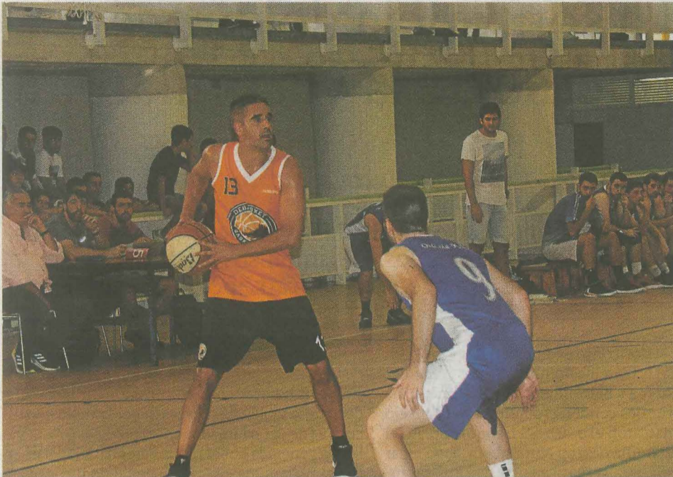
lagoba ekipoko onenatarikoa izan zen. :: ANDER SALEGI