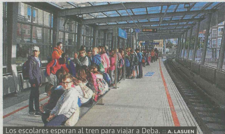
Los escolares esperan al tren para viajar a Deba.

nes en las aulas y posteriormente, con material de estudio (probetas, material para analizar la calidad del agua y otros elementos necesarios para el análisis del sistema costero) visitan la costa de Deba y recogen los datos necesarios, que después son enviados para ser analizados por expertos. Los jóvenes también conocen in situ la flora y fauna del ecosistema costero y limpian la zona, mientras disfrutaban de una jornada divertida de aprendizaje. Ermua participa desde hace décadas.