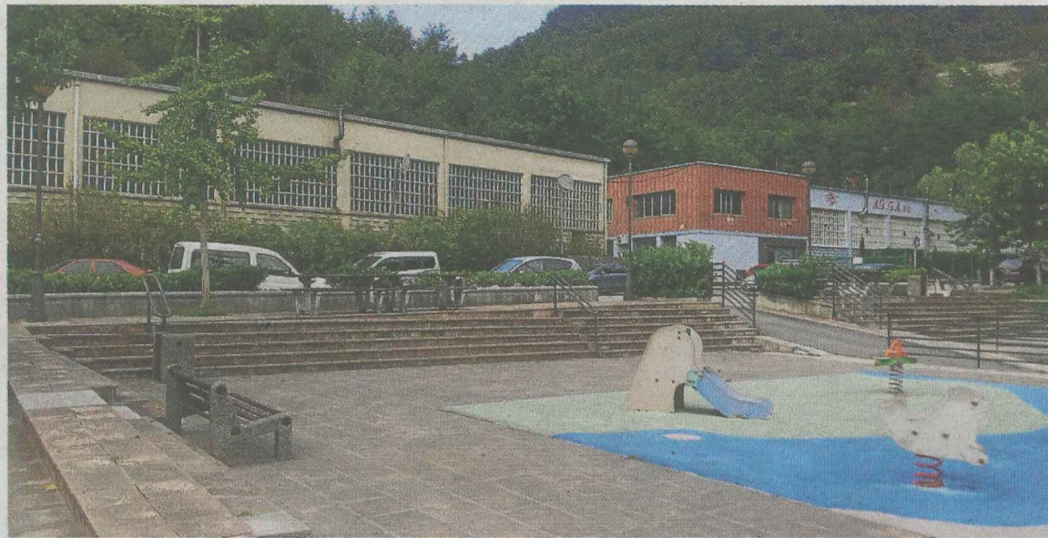
Zona de Okinzuri en la que se plantea la actuación de construcción de viviendas.

Dentro de esta unidad de ejecución se deberá también correr con el derribo del anexo de la iglesia pa-