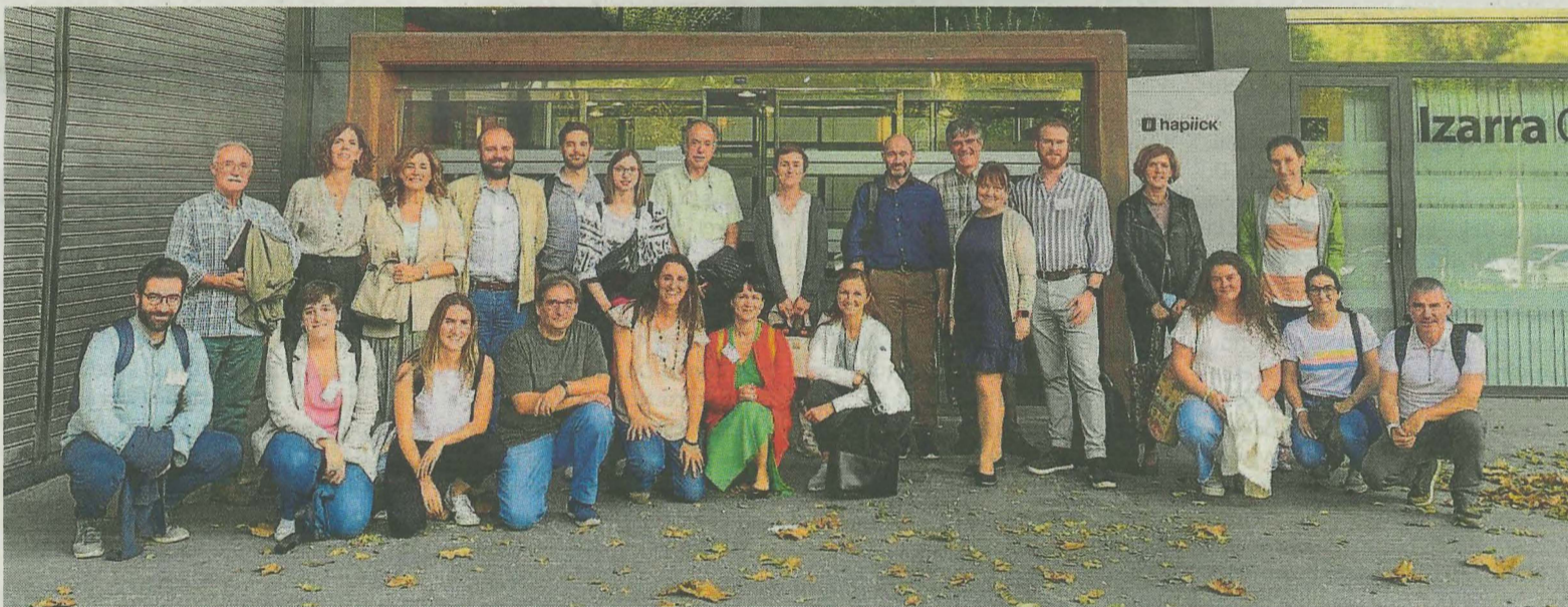
El programa, que contempla un proceso participativo de los vecinos, arrancará el próximo mes de febrero.

El proyecto, apoyado por el programa Horizonte Europa de la Unión Europea, cuenta con la colaboración de Promoción Económica de Ermua (Promosa), Mondragón Goi Eskola Politeknikoa, Unión de Cooperativas de Vivienda de Estonia (EKYL), Institute of Baltic Studies, Consorzio Materahub Industrie Culturali e Creative, Housing Europe y las ciudades de Elva (Estonia) y Matera (Italia) ●