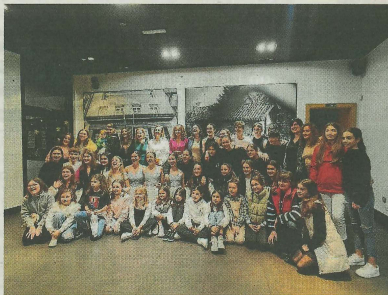
La entrega del premio tuvo lugar ayer a la tarde.

Allí, representantes de la asociación Astarloa pusieron en valor el trabajo que desempeña esta escuela, la única en la villa con estas disciplinas y que actualmente cuenta con más de 400 alumnos y alumnas de Durangaldea. “Además, este año ha sido premiada a nivel estatal como la mejor academia por trabajar un abanico amplio de estilos que se dividen en tres bloques: danza urbana, contemporánea y el ballet, la danza clásica. El año anterior también recibieron el Premio Duende de Oro a la mejor escuela de danza del Estado entre más de mil que no son un centro profesional”, explica-