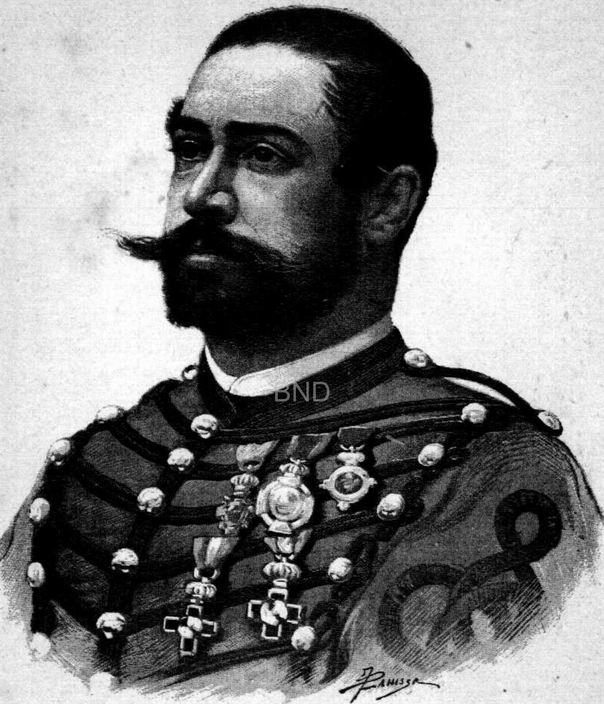
DON CÁNDIDO DE ORBE