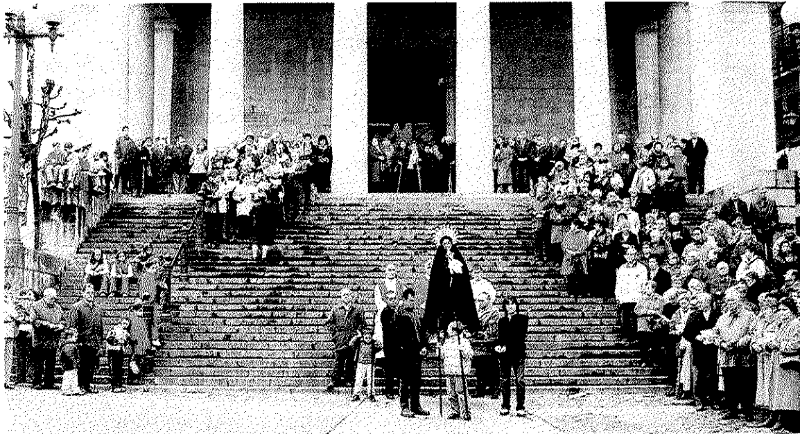
Virgen Dolorosa. Un momento de la procesión que volverá a celebrarse mañana.