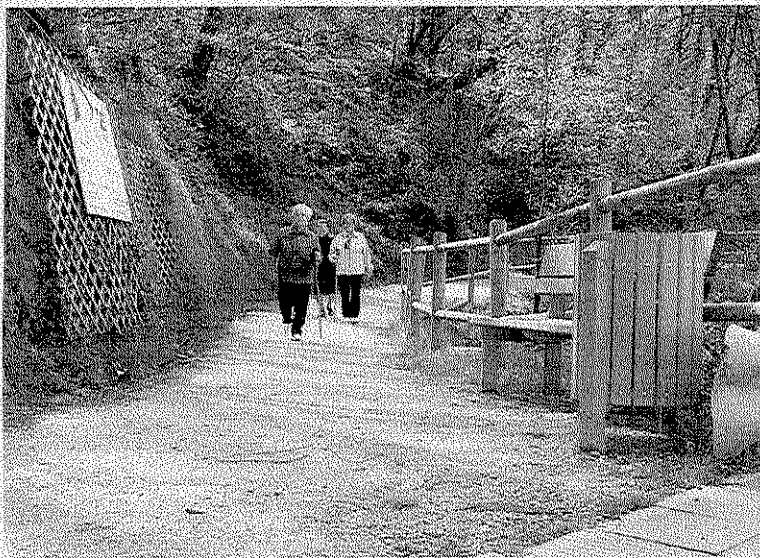
Varias mujeres pasean por el sendero de Urtia.

El tercer tramo va desde la carretera de Berano a la fuente de Asuntza y el cuarto, que completa los 16 kilómetros, desde la ermita de Arteta, hasta Rekalde. Este es un paseo de alrededor de 4 horas.