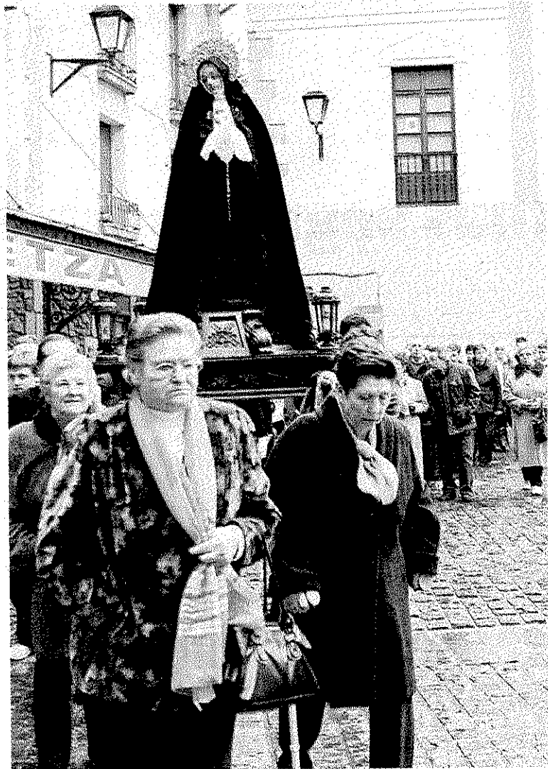
Devoción. La procesión se sigue en silencio.

Pazko Astelehenak eguraldi onarekin batera Galdonako jaiak ekarriko ditu. 12:00etan meza izango da aire librean eta ondoren Azpilla eta Mañukorta bertsoarien saioa. 18etan herri kirolen saioa izango da; harrijasotzen Landarbide eta Telleria; aizkoran Mugerza eta Kañameres eta ondoren Gorriti eta bere abereak. Etxera itzuli aurretik ohiko arkume zozketa burutuko da asteartean bateren bat gozatuta buelta dadin bere eginkizunetara.