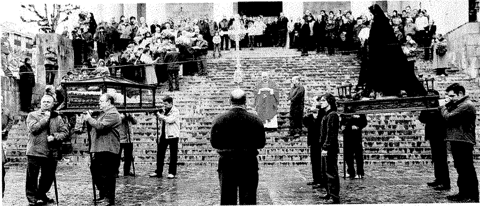
En la plaza. Los pasos del Santo Sepulcro y la Virgen Dolorosa recorren la plaza antes de regresar al templo.