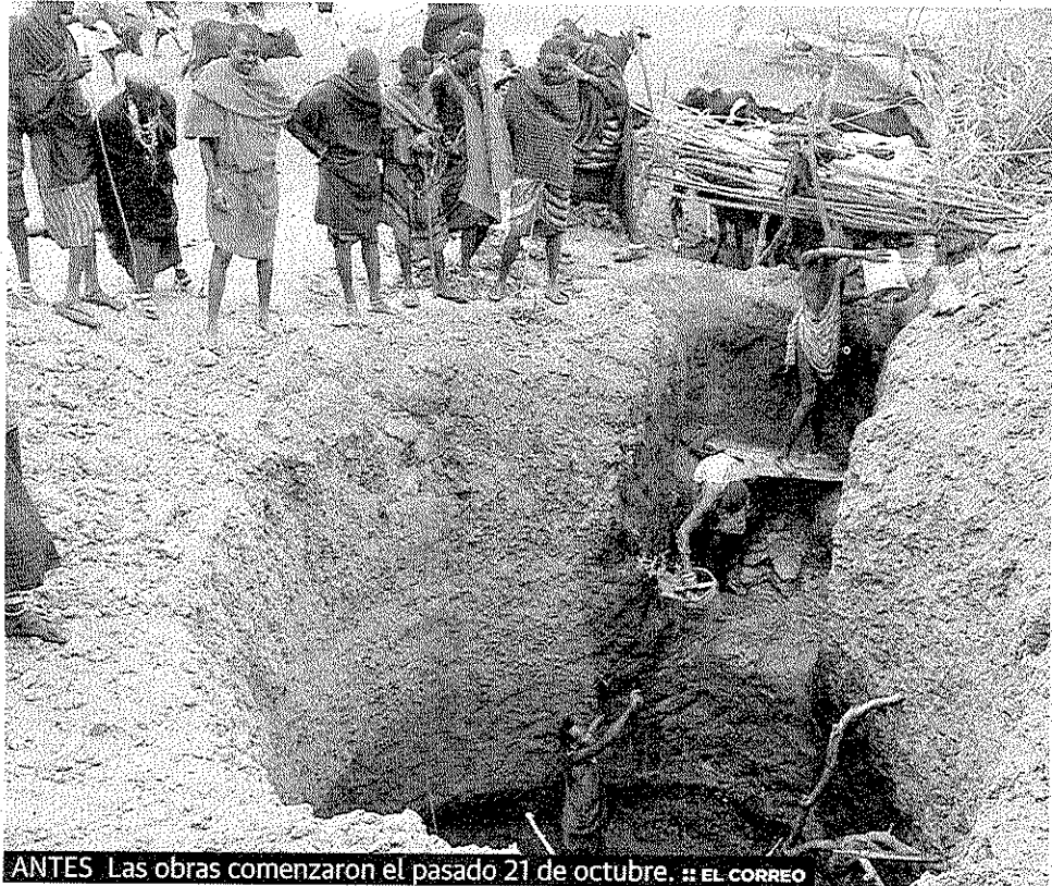
ANTES Las obras comenzaron el pasado 21 de octubre.