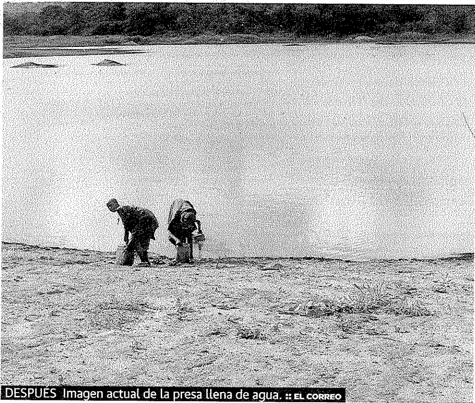
DESPUÉS Imagen actual de la presa llena de agua.