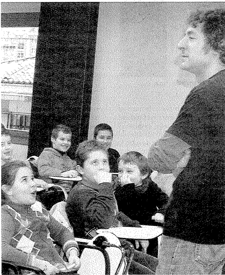
Encuentro del escritor con jóvenes escolares ermuarra. ■ A.L.