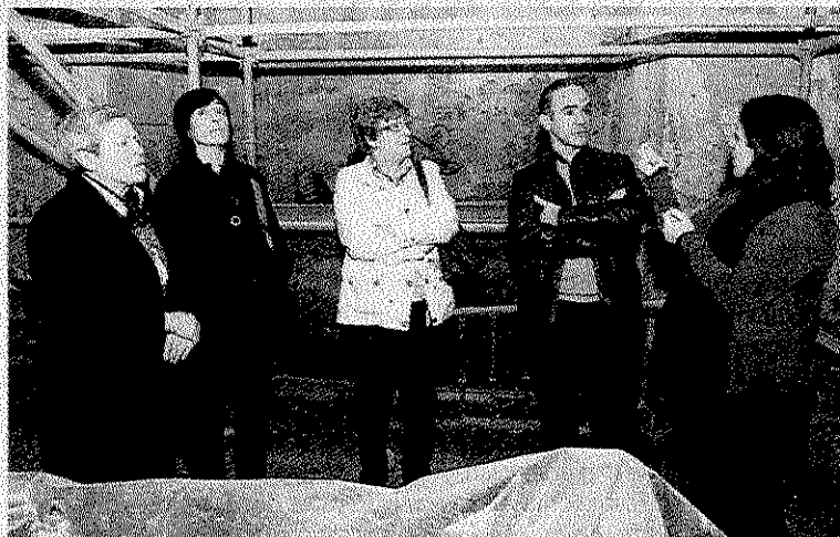
La diputada y los alcaldes atienden las explicaciones de un técnico.