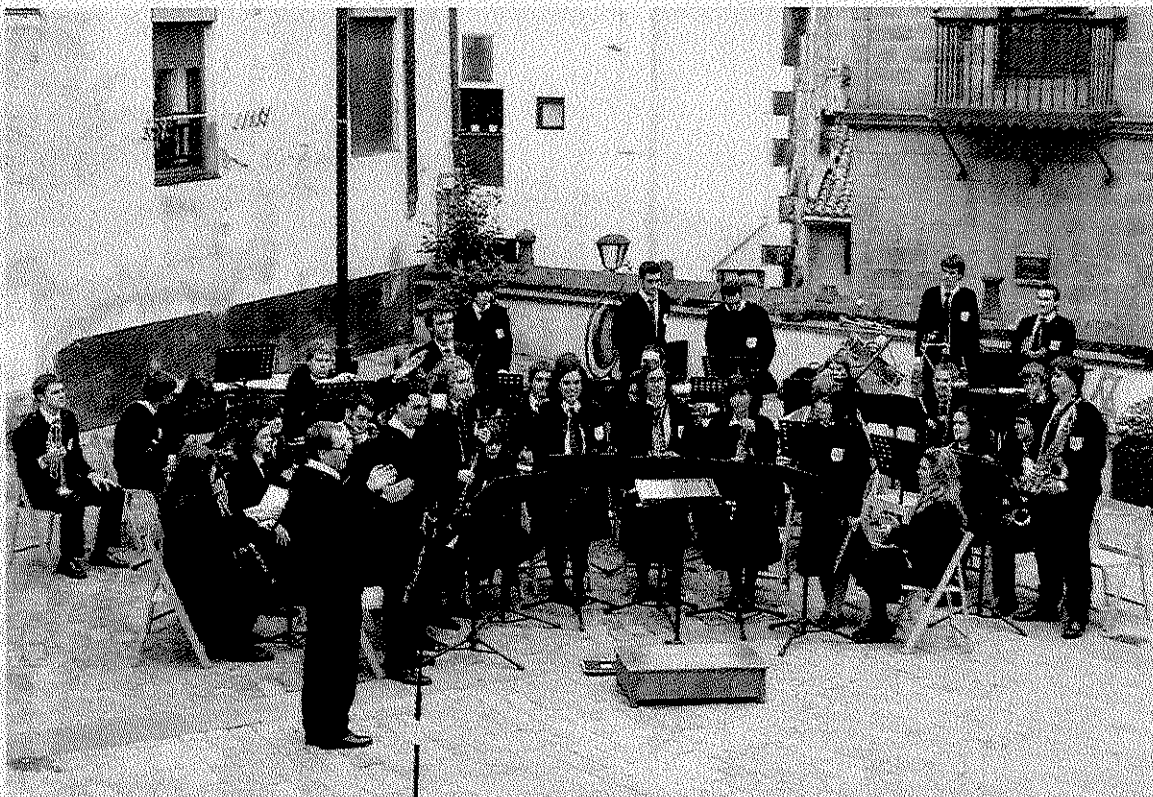
La Banda de Música se ha adecuado perfectamente al nuevo espacio y al calendario. de GORRITIBERIA

Como dato señalar que el pasado sábado todos los jugadores del