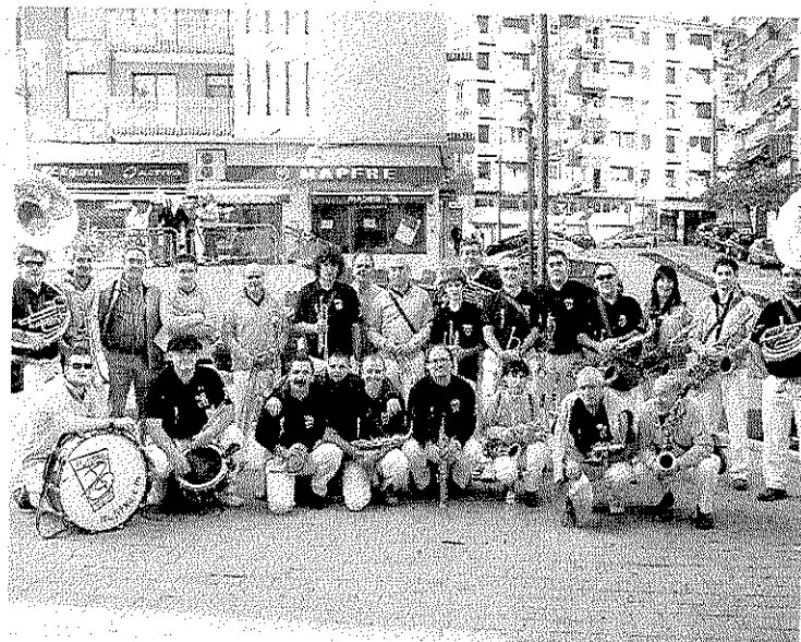
Los integrantes de Irulitxa preparan su viaje a Francia.

Actualmente Irulitxa cuenta con 28 personas y más de medio centenar de canciones de repertorio (17 pasacalles y 34 canciones de corro). Surgió como un anejo de cuadrilla, organizando unas espontáneas fanfarrias después de cenas en sus excursiones a La Rioja. «Entonces no nos hacían falta instrumentos, ya que simulábamos los sonidos, pero una vez que se crea la sociedad Txalaparta, en el año 94, pensamos que debíamos ponernos en marcha», aclaran.