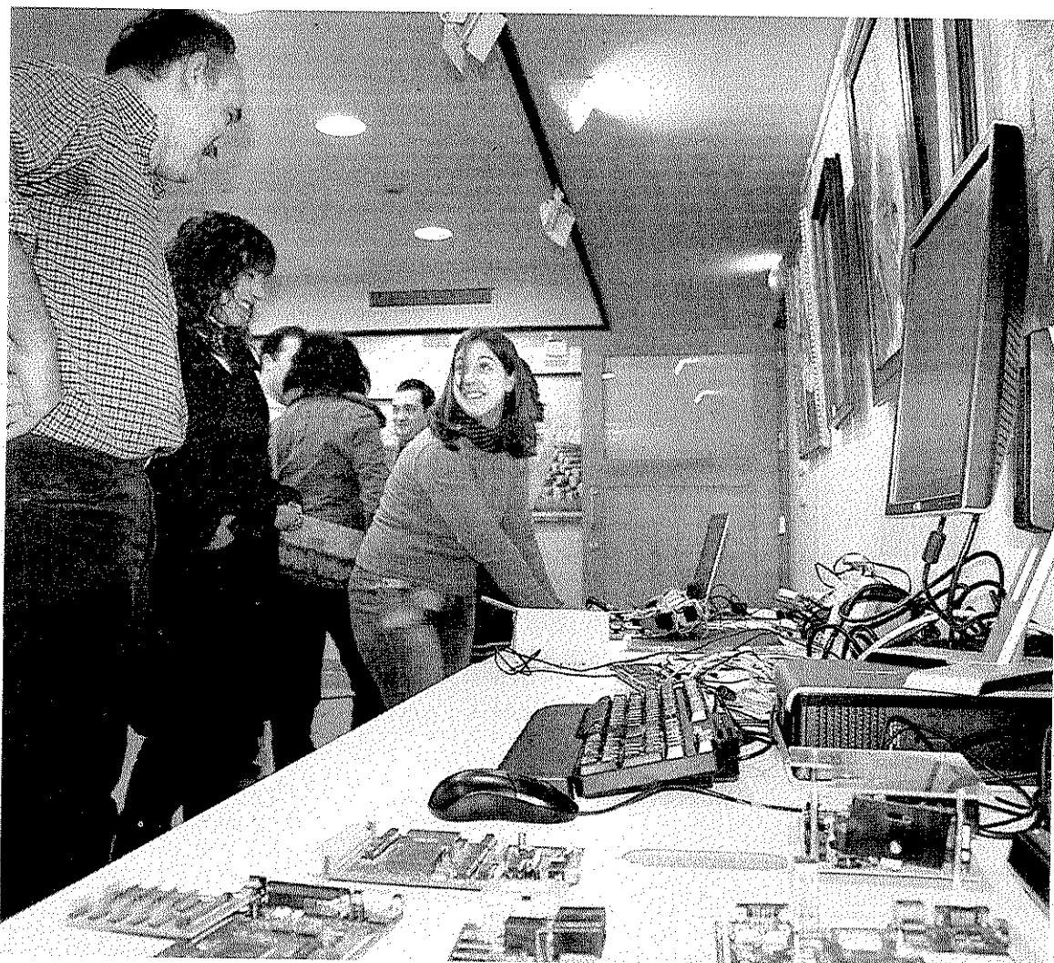
Actividades organizadas en una edición anterior de este programa de actividades. :: A. L.