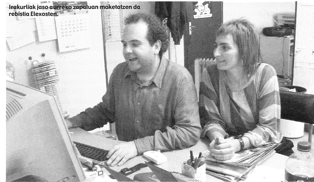
Irakurliak jaso aurreko zapatuan maketatzen da rebestia Elexosten.