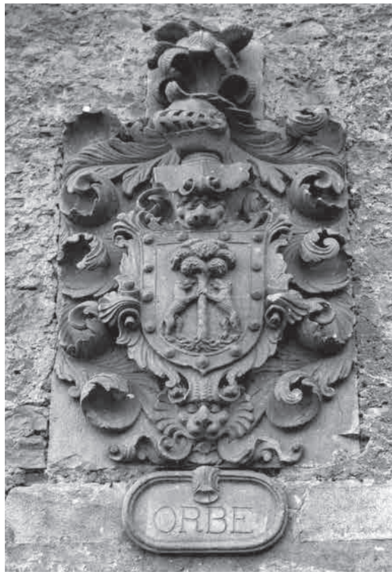
Fig. 1. Escudo de armas de la familia Orbe en la casa solar de Anguiozar, Guipúzcoa

La familia Orbe antedicha tiene su origen histórico en el caserío de Anguiozar, entonces perteneciente a Elgueta y más tarde a la villa de Vergara, Guipúzcoa, donde aún subsiste la casa solar de Orbe con el siguiente escudo de armas esculpido en su fachada: en campo de oro un pino con dos lobos empinados y bordura roja con trece besantes de oro (3).