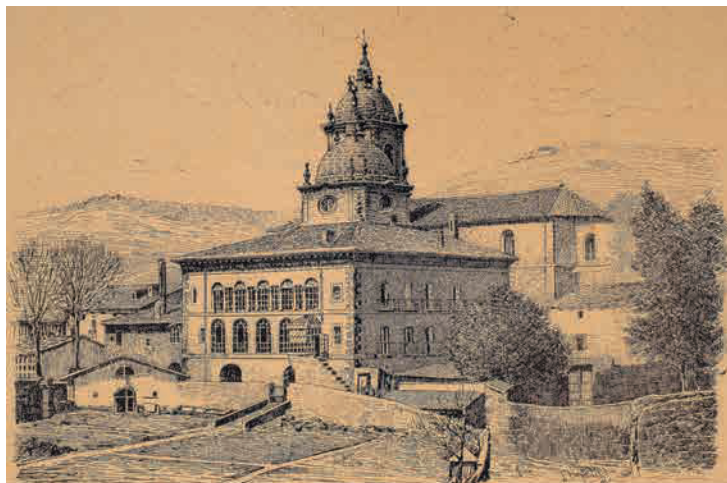
Fig. 4. Palacio del Marqués de Valdespina en Ermua, Vizcaya ( El Estandarte Real. Revista Político-Militar Ilustrada , año II, nº 21, Barcelona, 1890)