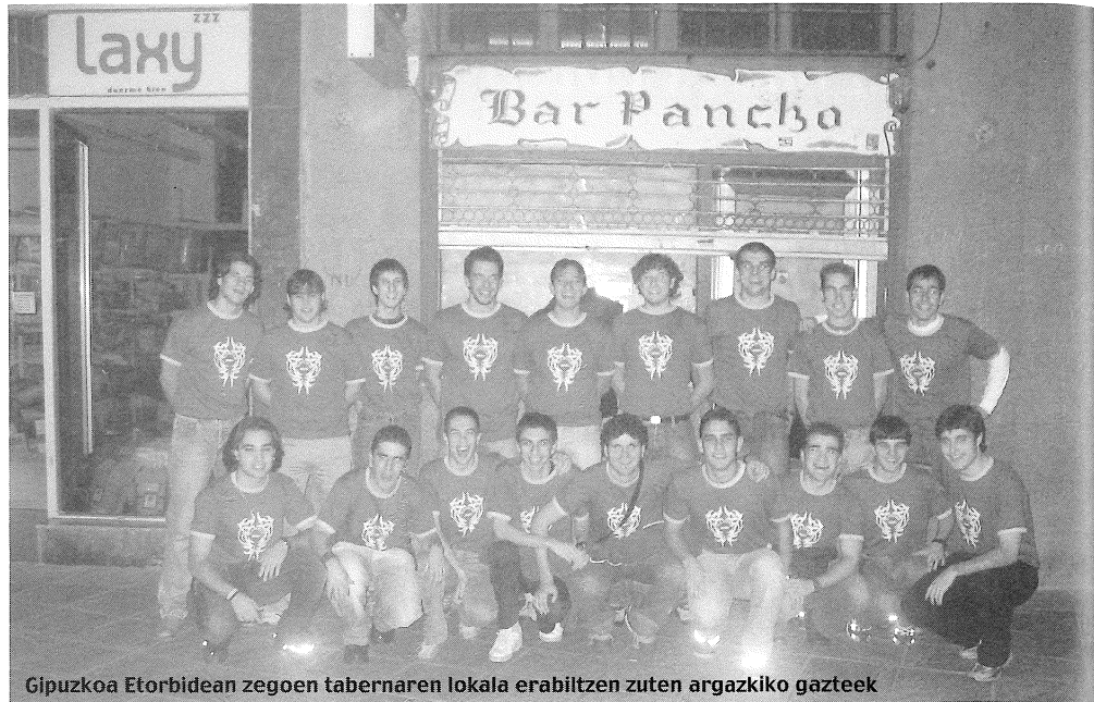
Gipuzkoa Etorbidean zegoen tabernaren lokala erabiltzen zuten argazkiko gazteek

Bigarren kategorian sartzen diren lokalen erabiltzaileekin ere egon gara. Zerukoan lokala duen gazte talde honek duela 2 urte alokatu zuen lokala. Gaur egun, 240 euroko alokairua ordaintzen dute. 16 gazte biltzen dira asteburuero bertan, hitz egiteko, elkar ikusteko, telebis-