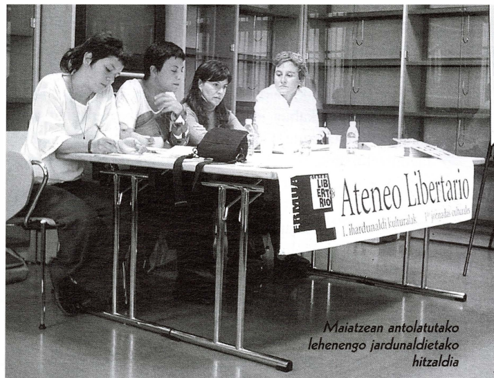
Maiatzaren antolatutako lehenengo jardunaldietako hitzaldia

A.L: Oraindik ez dugu gure artean eztabaidatzeko astirik izan. Batez ere, gauzak antolatzen ibili gara eta lokalaren kontua aztertzen. Epe laburrera begira, inguruko 20 musika talde ezber-